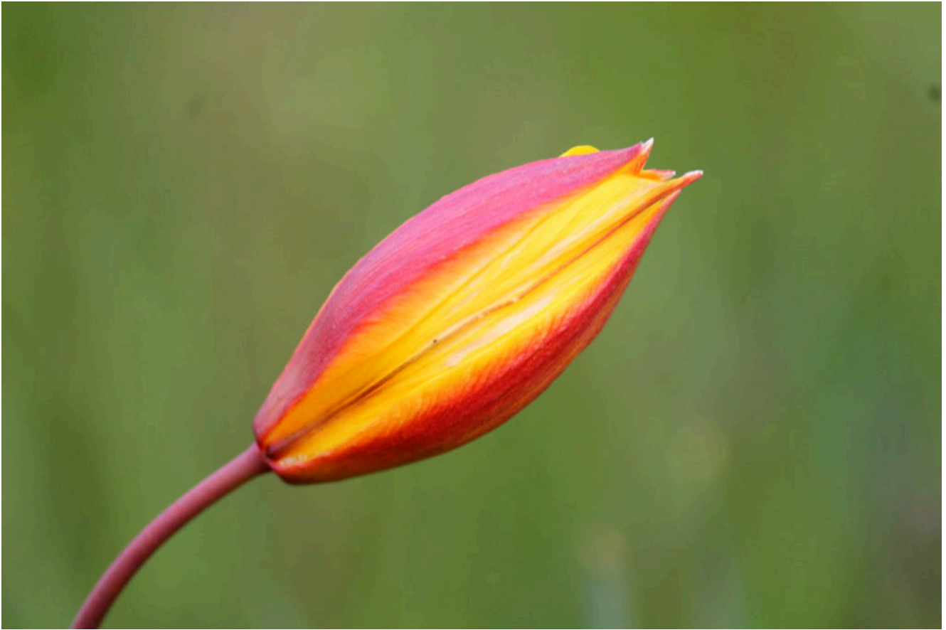
1- Il tulipanetto giallo del Piano Grande: “ tulipa australis ”