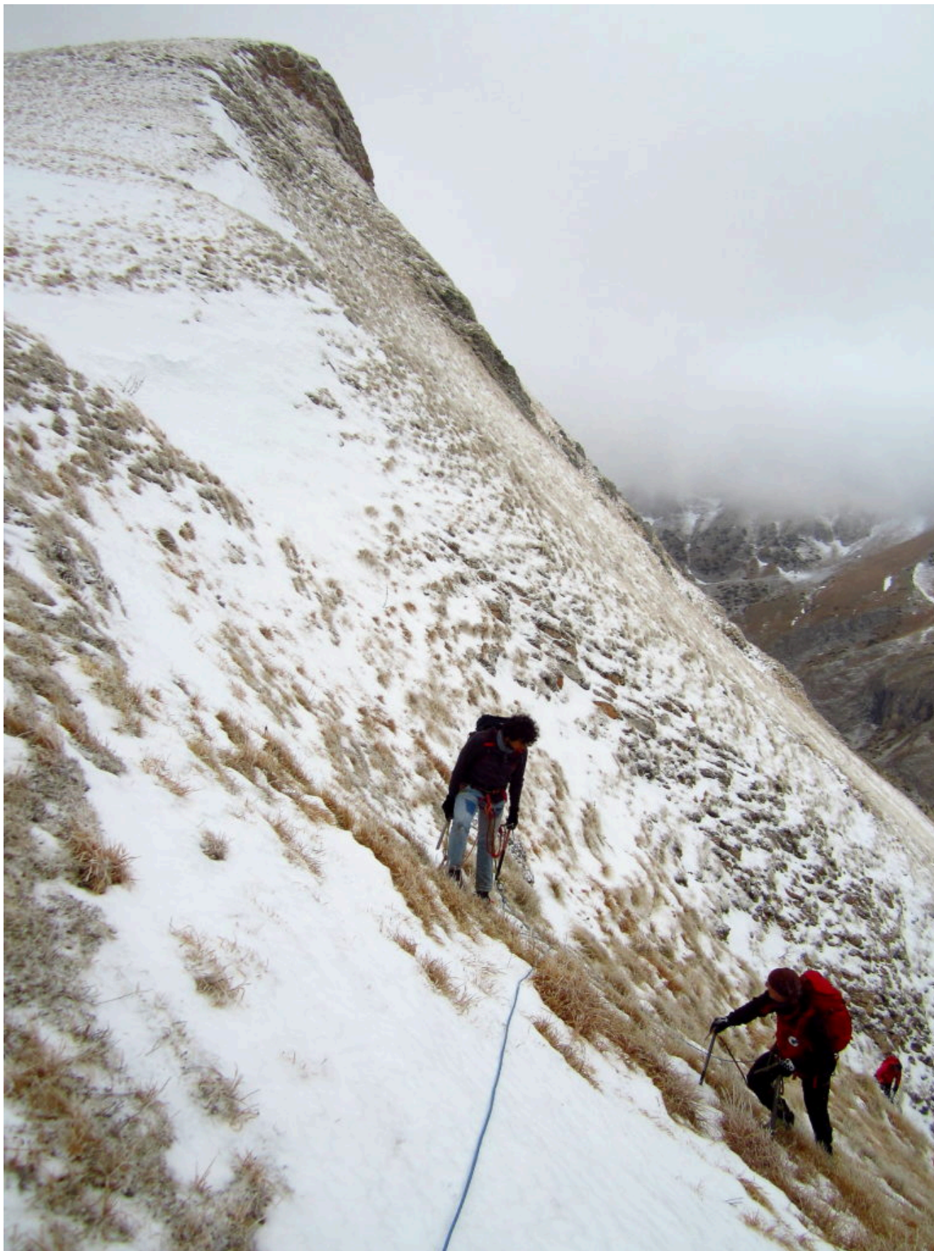
15- L'uscita nei pressi di Cima Acquario, a sinistra.