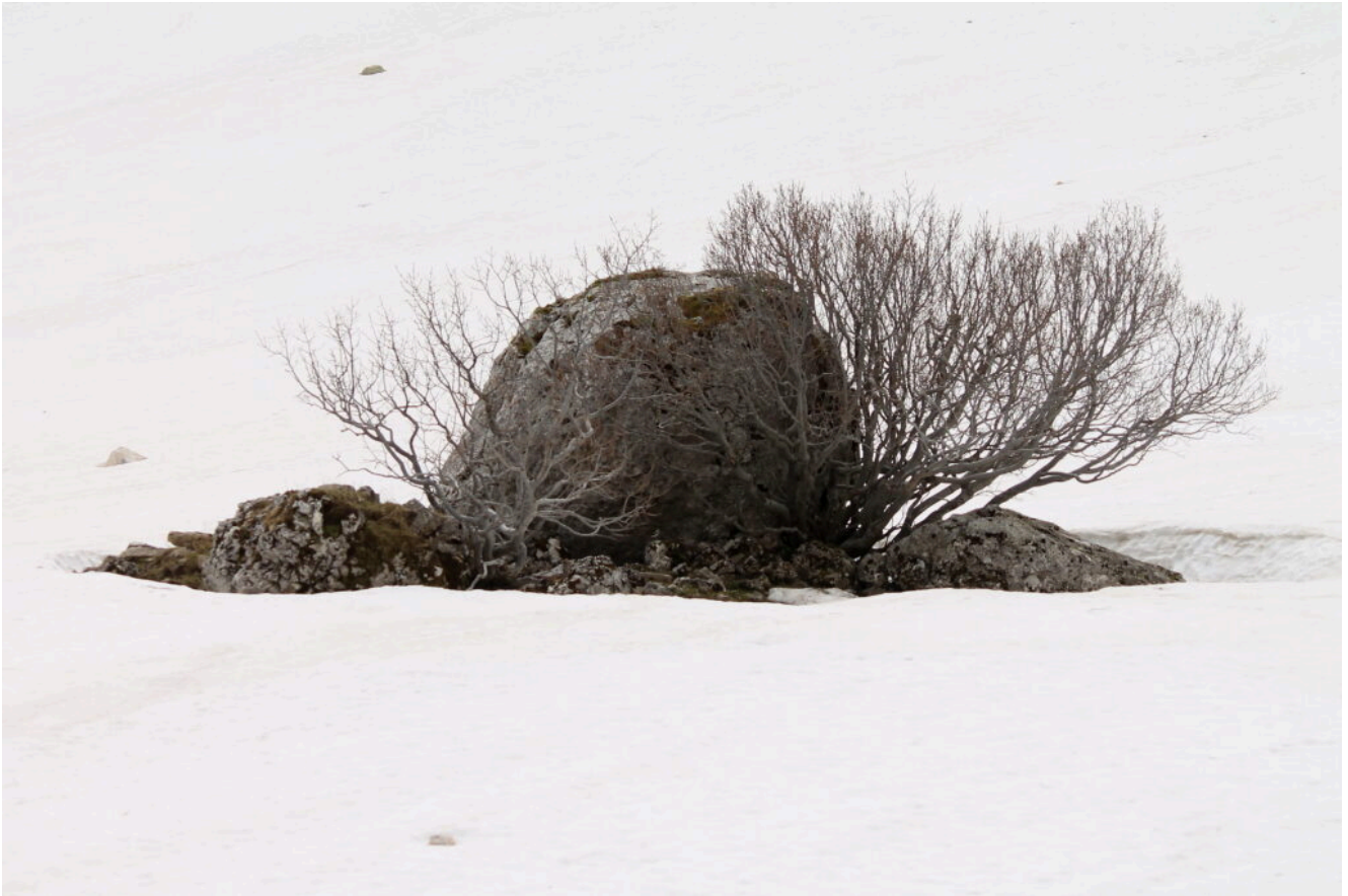
27- Masso caduto in tempi immemorabili è stato circondato da arbusti.