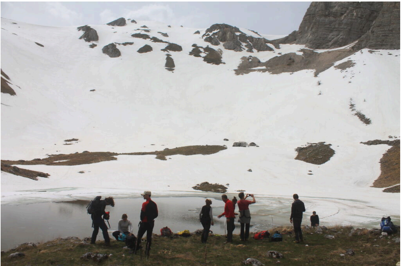
28- Aperitivo delle ore 12 al Laghetto con 15 persone.