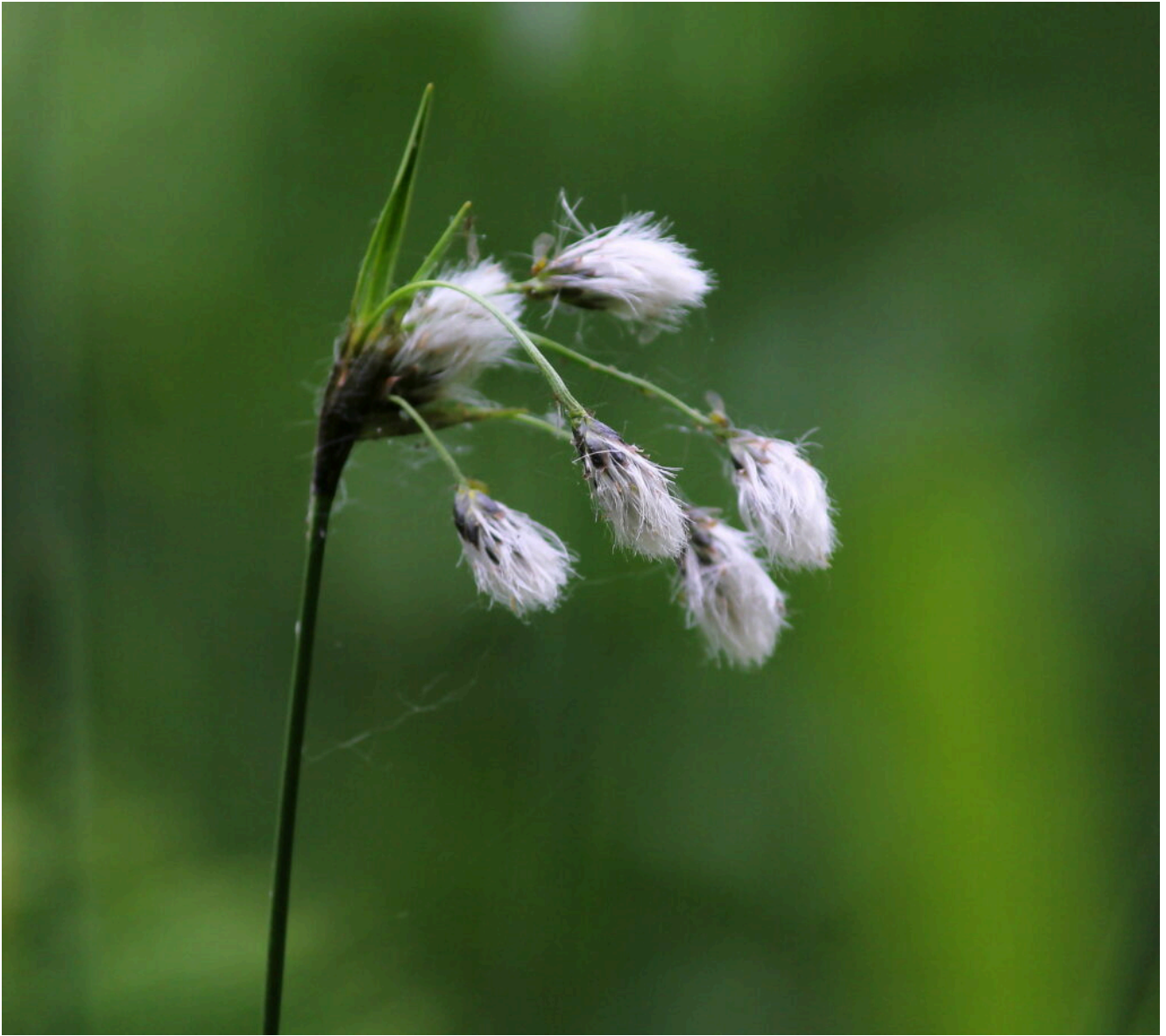
15- Eriophorum latifolium caratteristico delle zone acquitrinose.