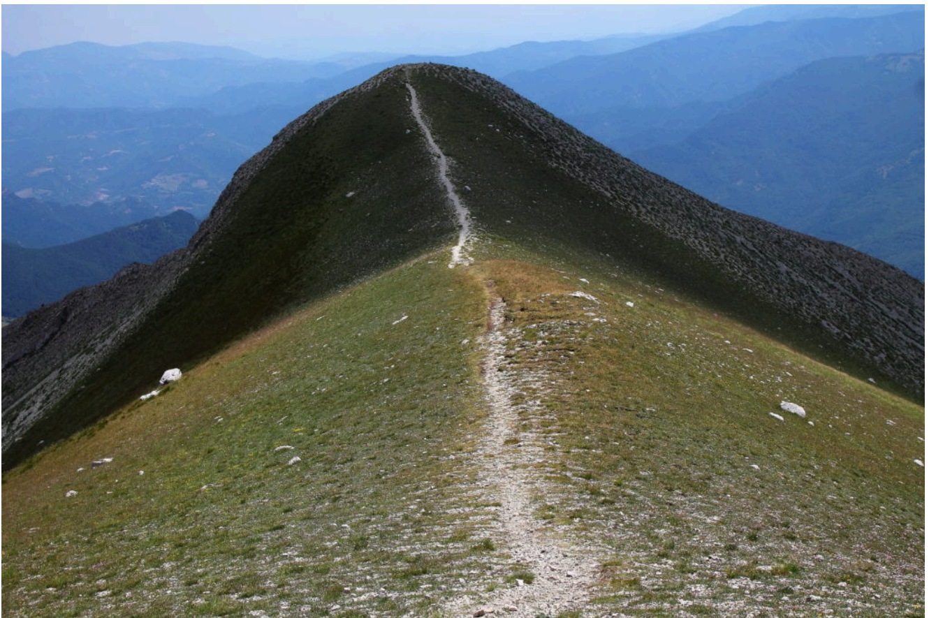
20- Il "mistero" geologico della Sella tra la Cima del Lago e la Punta di Prato Pulito posta di fronte: come sono giunti i massi di roccia diversa da quella del pendio sul prato a