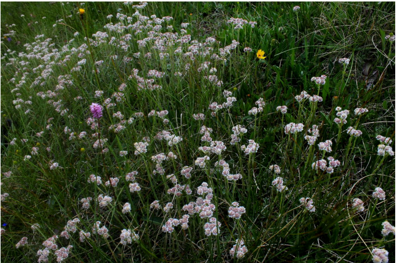
24- Ricca stazione di Antennaria dioica nel versante Nord