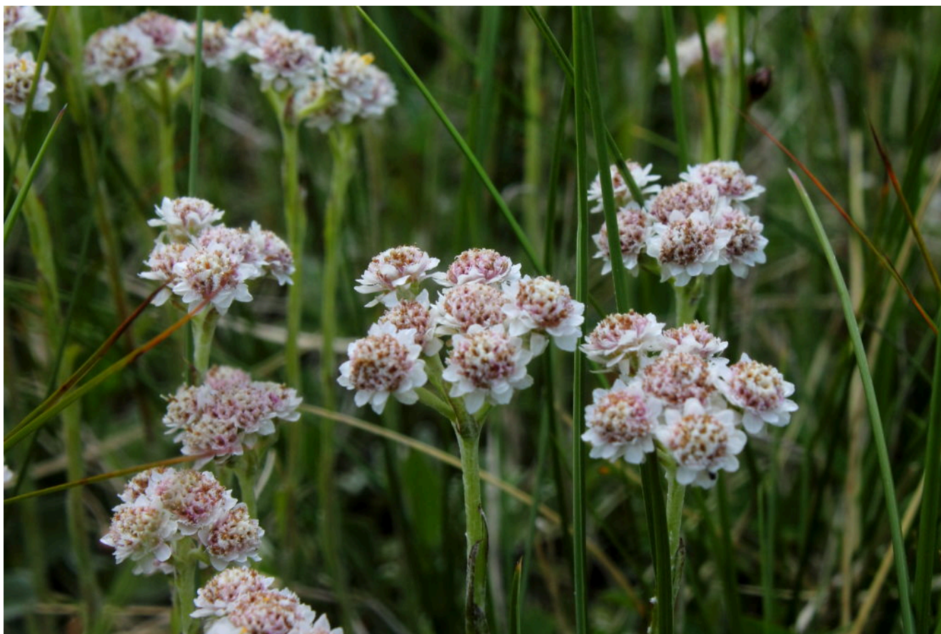
25- Particolare dell'infiorescenza di Antennaria dioica