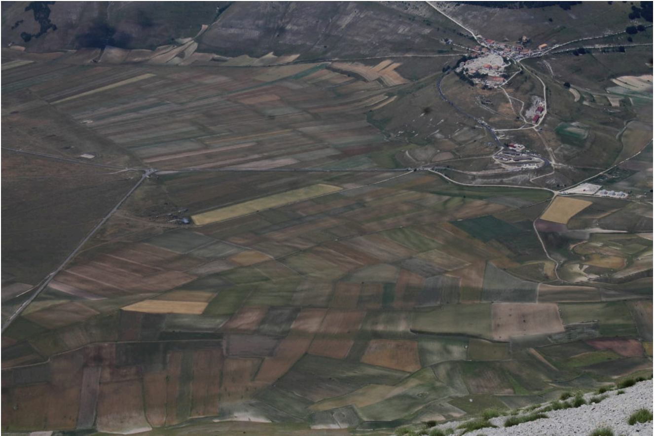
17- Castelluccio con la parte superiore del paese ridotta ad un cumulo di macerie e i vari campi della fioritura ormai secchi.