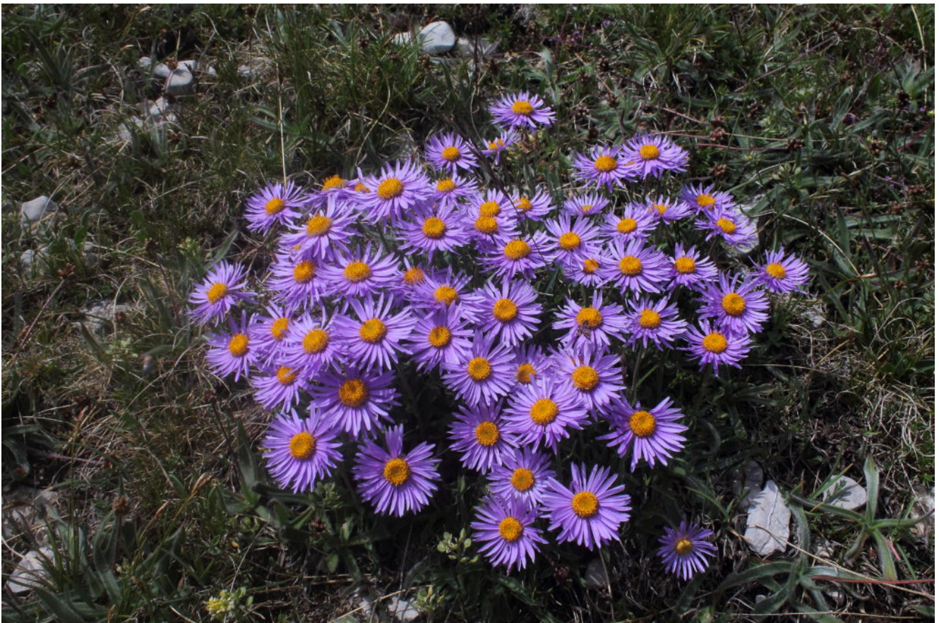
18- Bellissimo gruppo di Aster alpinus.