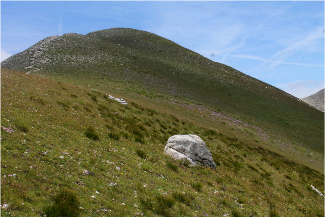
23- Gli stessi massi della foto n.22 visti verso la Cima del Lago sullo sfondo, come si nota non ci sono pareti rocciose più in alto da cui possono provenire.