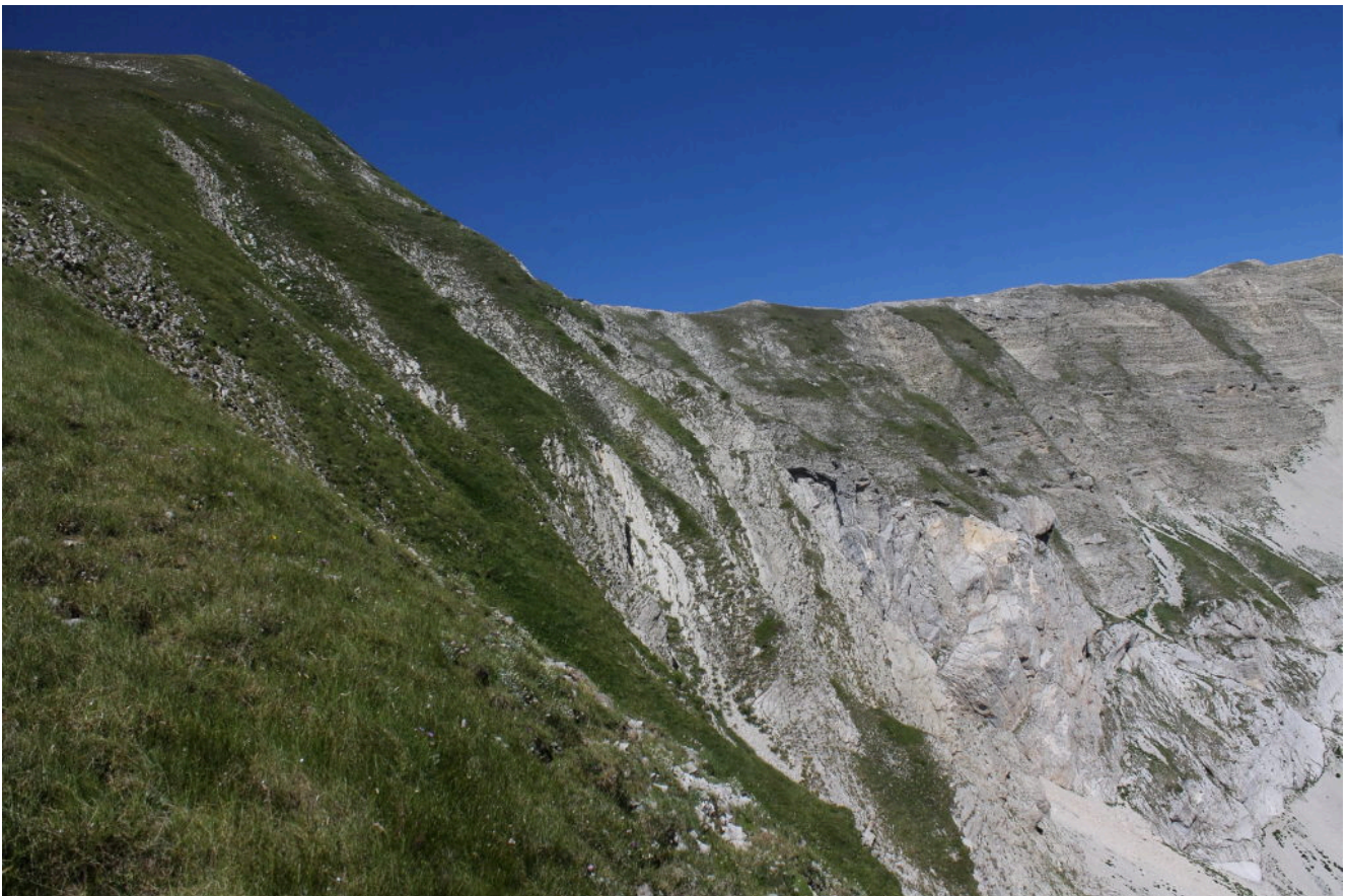
3- L'inizio del tratto più ripido, si notano le uscite dei canali di salita invernale e a destra la cresta che dalla Cima del Lago va verso la Cima del Redentore.