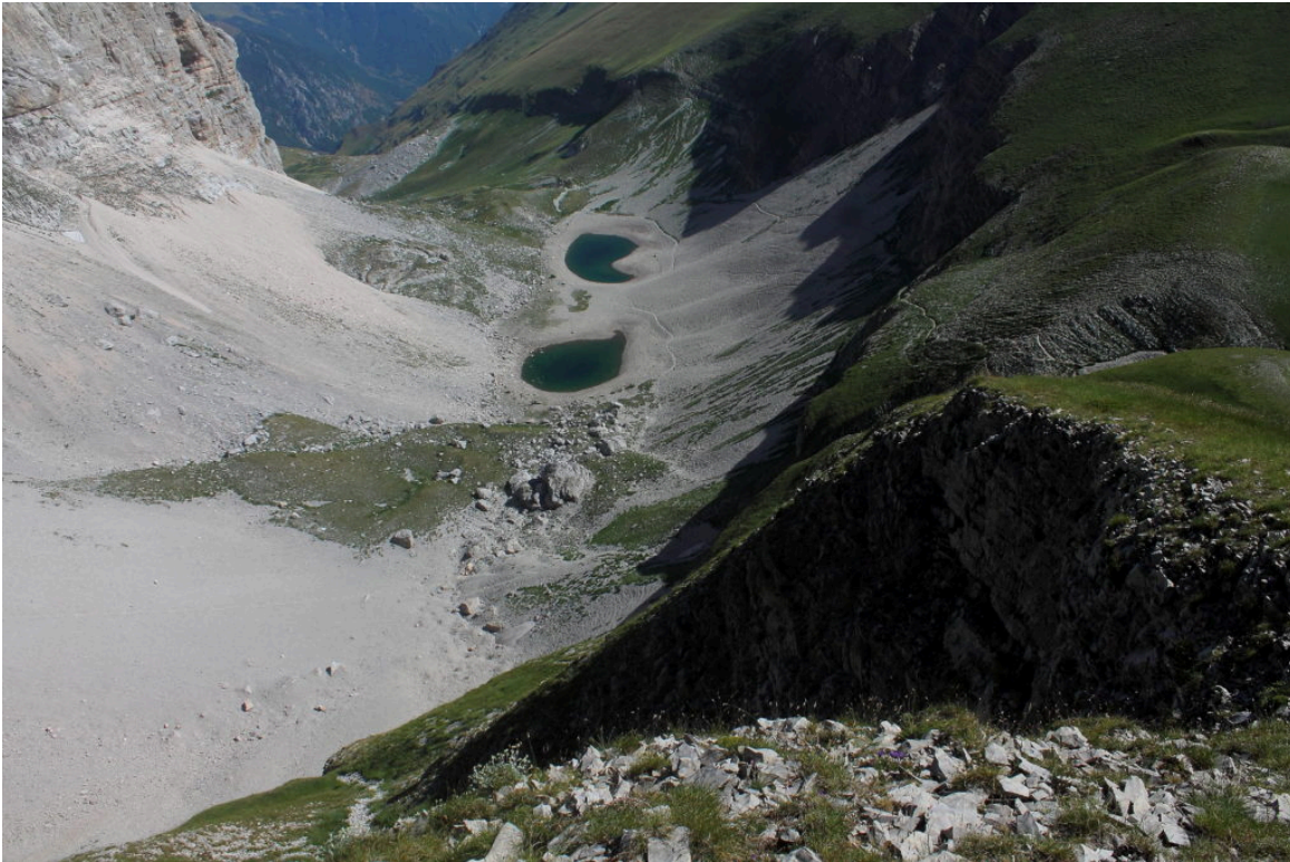
2- Veduta verticale sulla conca del Lago di Pilato in evidente crisi idrica, a destra è visibile il sentiero che scende dalle "roccette" verso il Lago.