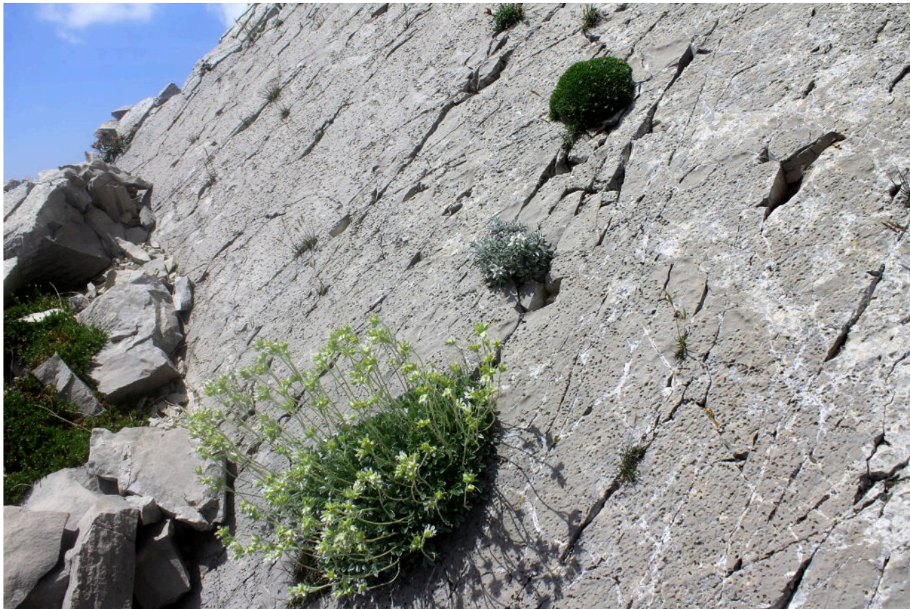
26- Sulle placche della cresta Sud della Punta di Prato Pulito, in successione dall'alto cuscini di : Silene