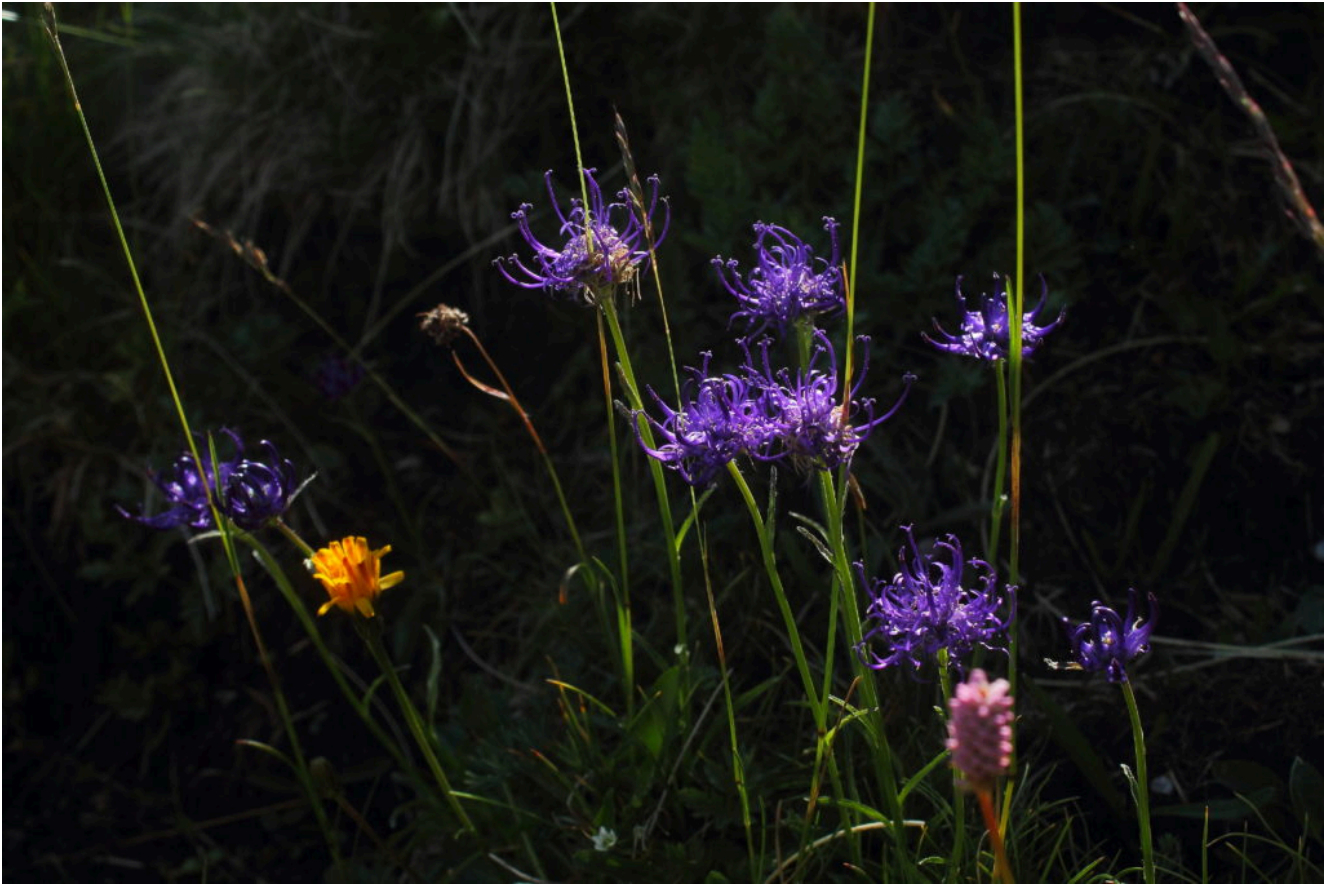
19- La particolare infiorescenza del Phyteuma orbicularis