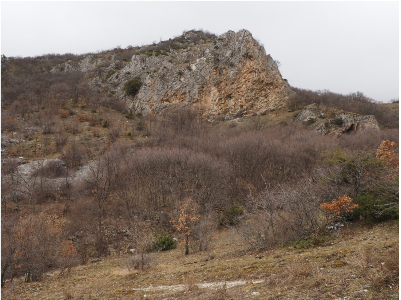
15- Le pareti di roccia rossa, alla base di quella a destra si apre la Grotta di Monte Patino.