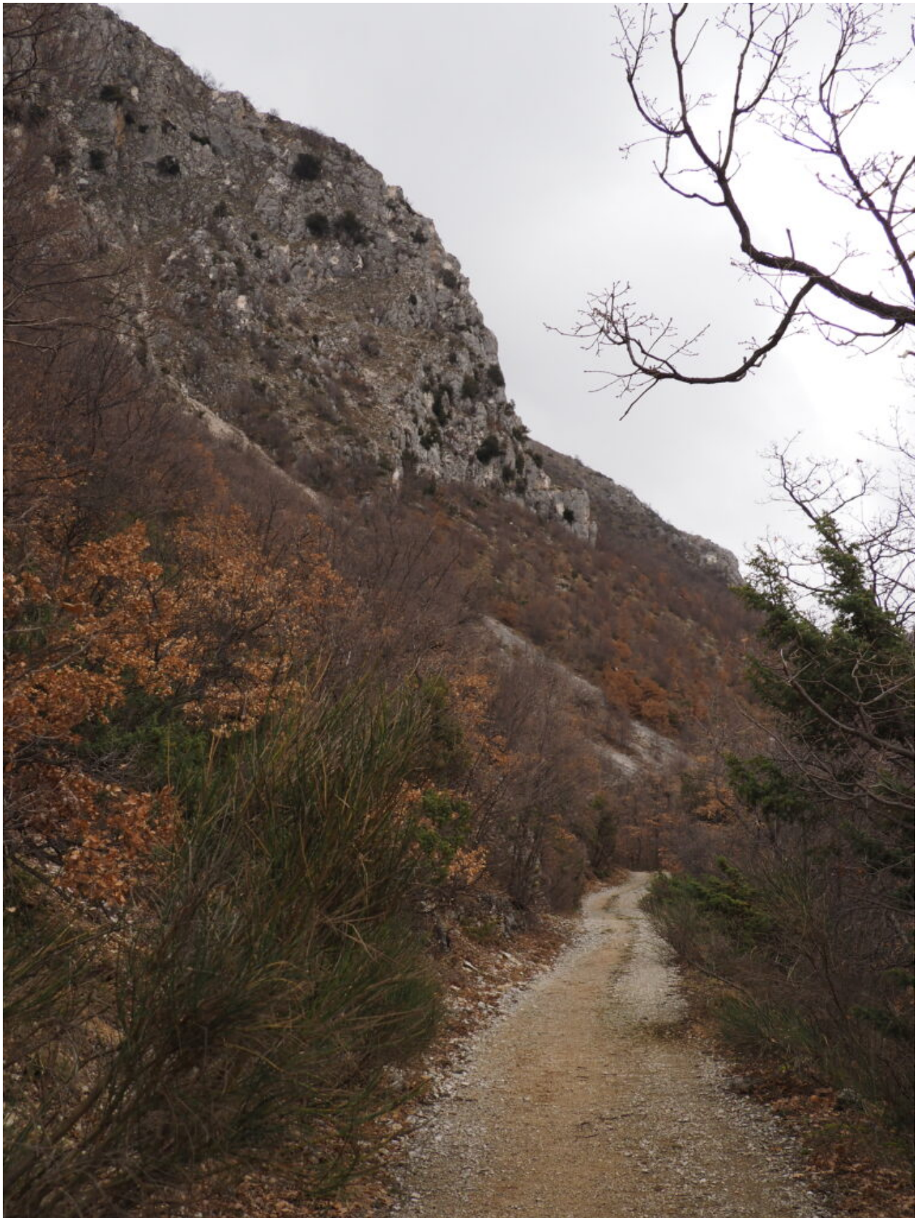
5- La alta parete che sovrasta la sterrata.