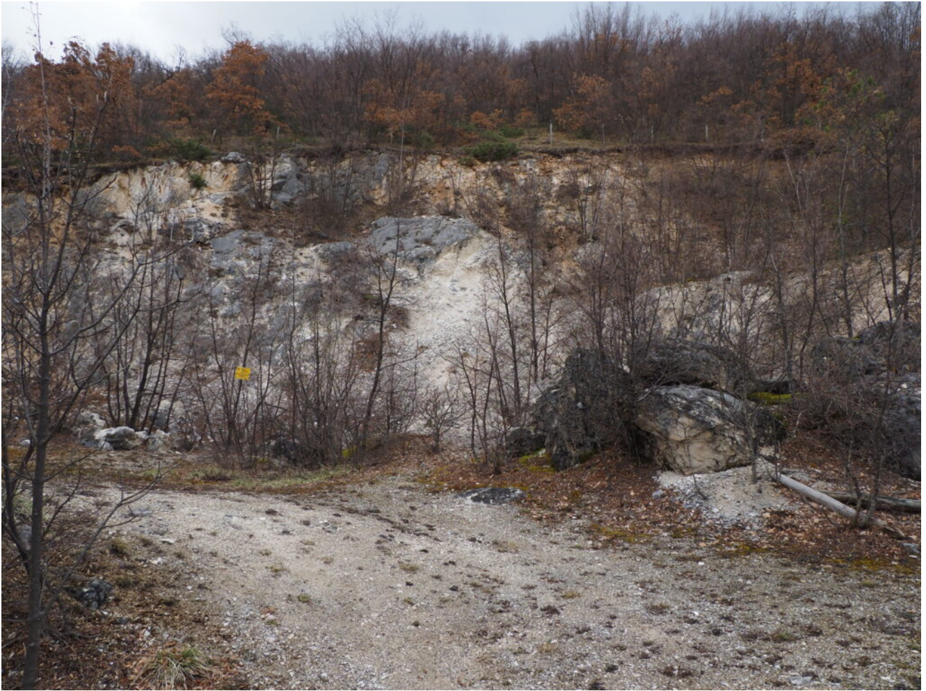
4- La piccola cava lungo il tratturo