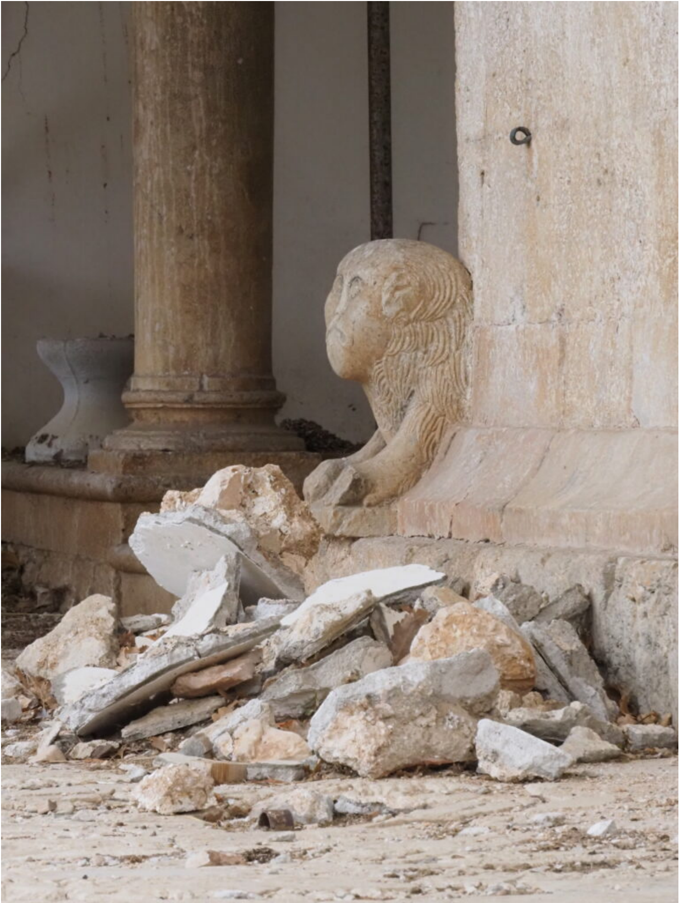
38- Due leoni scolpiti su pietra intorno all'anno 1000 caratterizzano l'ingresso della chiesa.