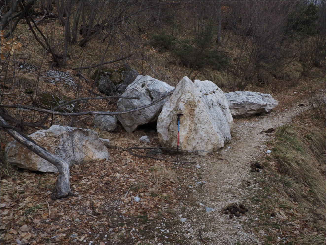
8- Altri grandi massi sulla strada.