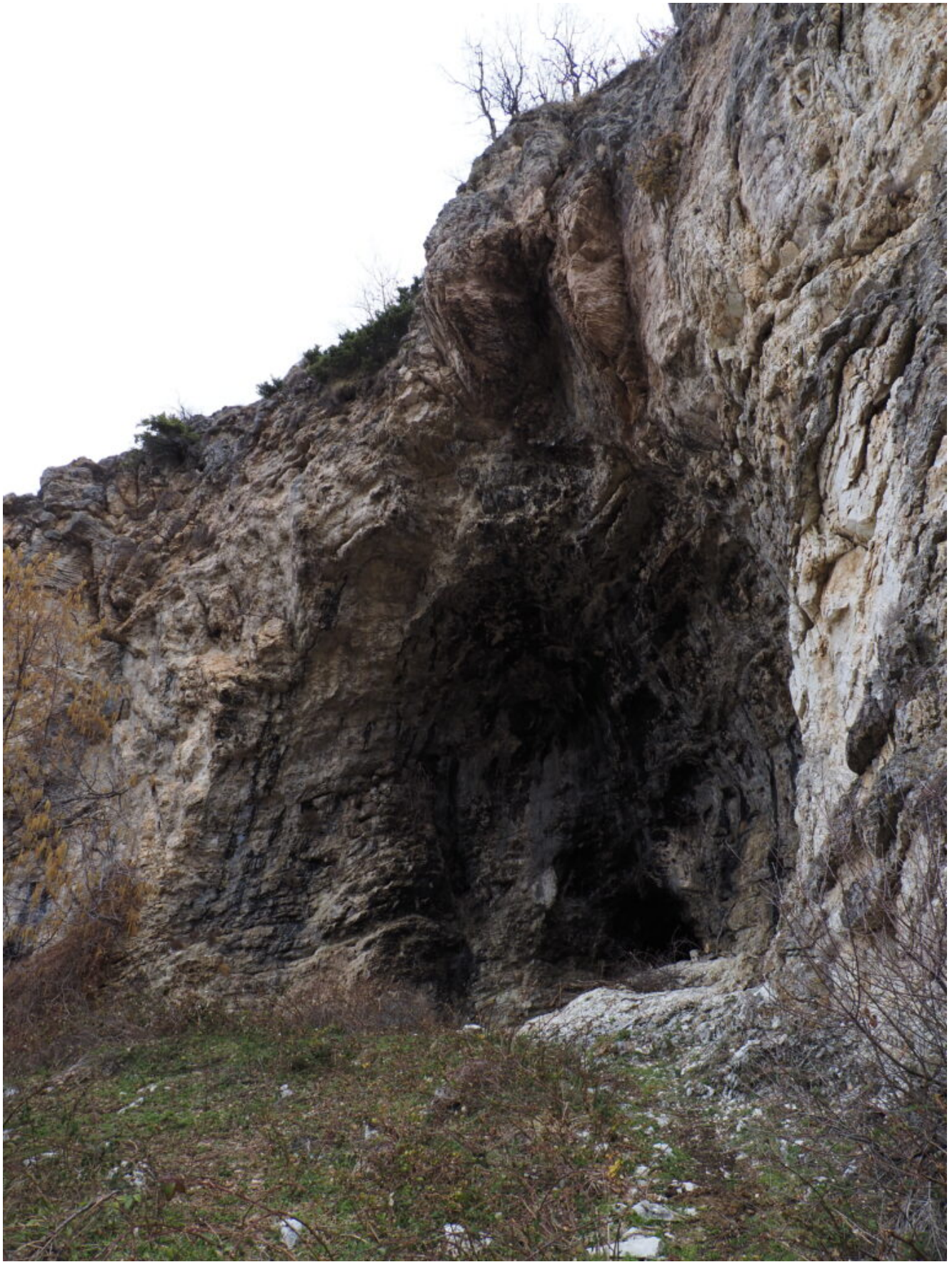
18-25- La Grotta di Monte Patino, la parete sovrastante reca i segni di secolari fuochi accesi dai pastori che la frequentavano