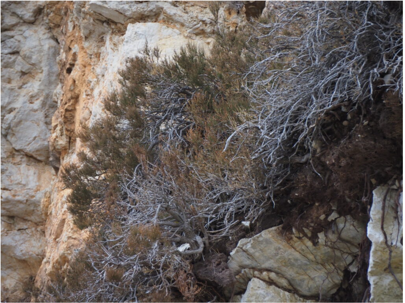
34-35- Una grande pianta di Ephedra nebrodensis cresce nella verticale parete rocciosa della fascia superiore