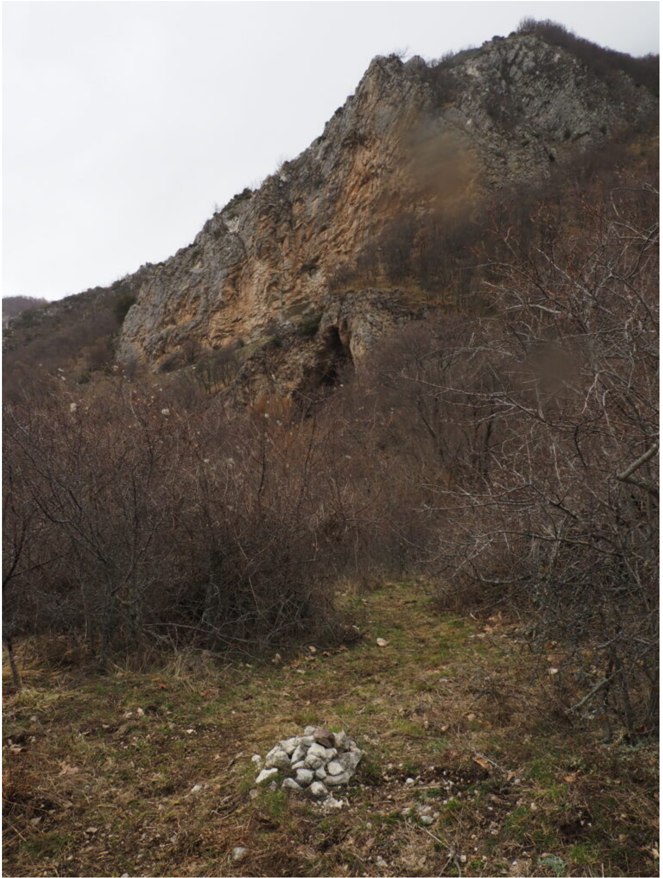
16- L'omino di pietre all'imbocco del sentiero che conduce alla Grotta di Monte Patino già visibile.