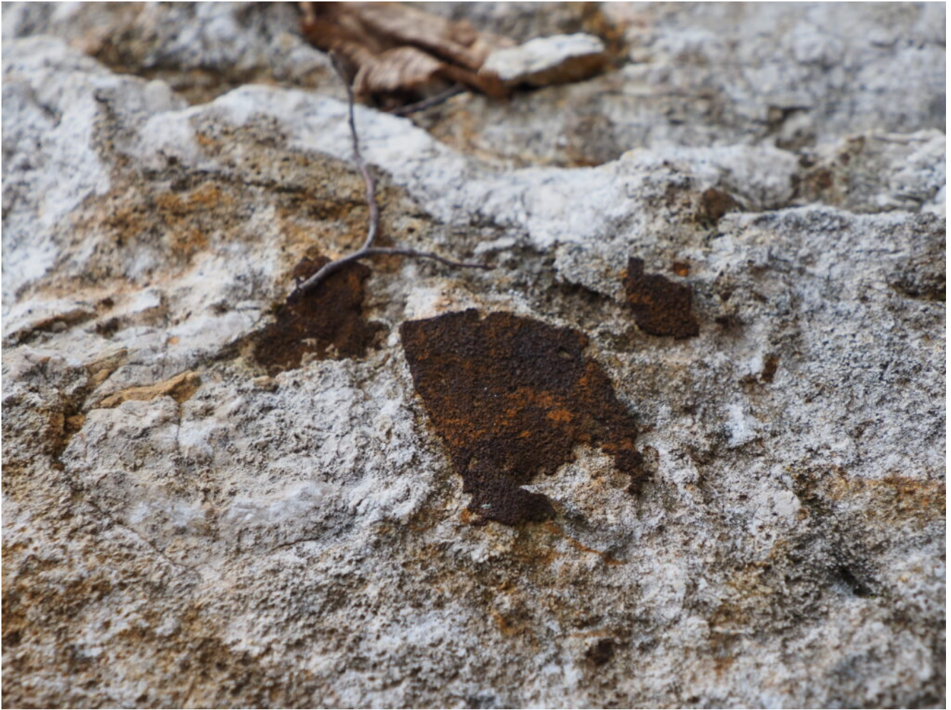
9 - 10 - i massi caduti dalla parete recano spalmature di minerali ferrosi