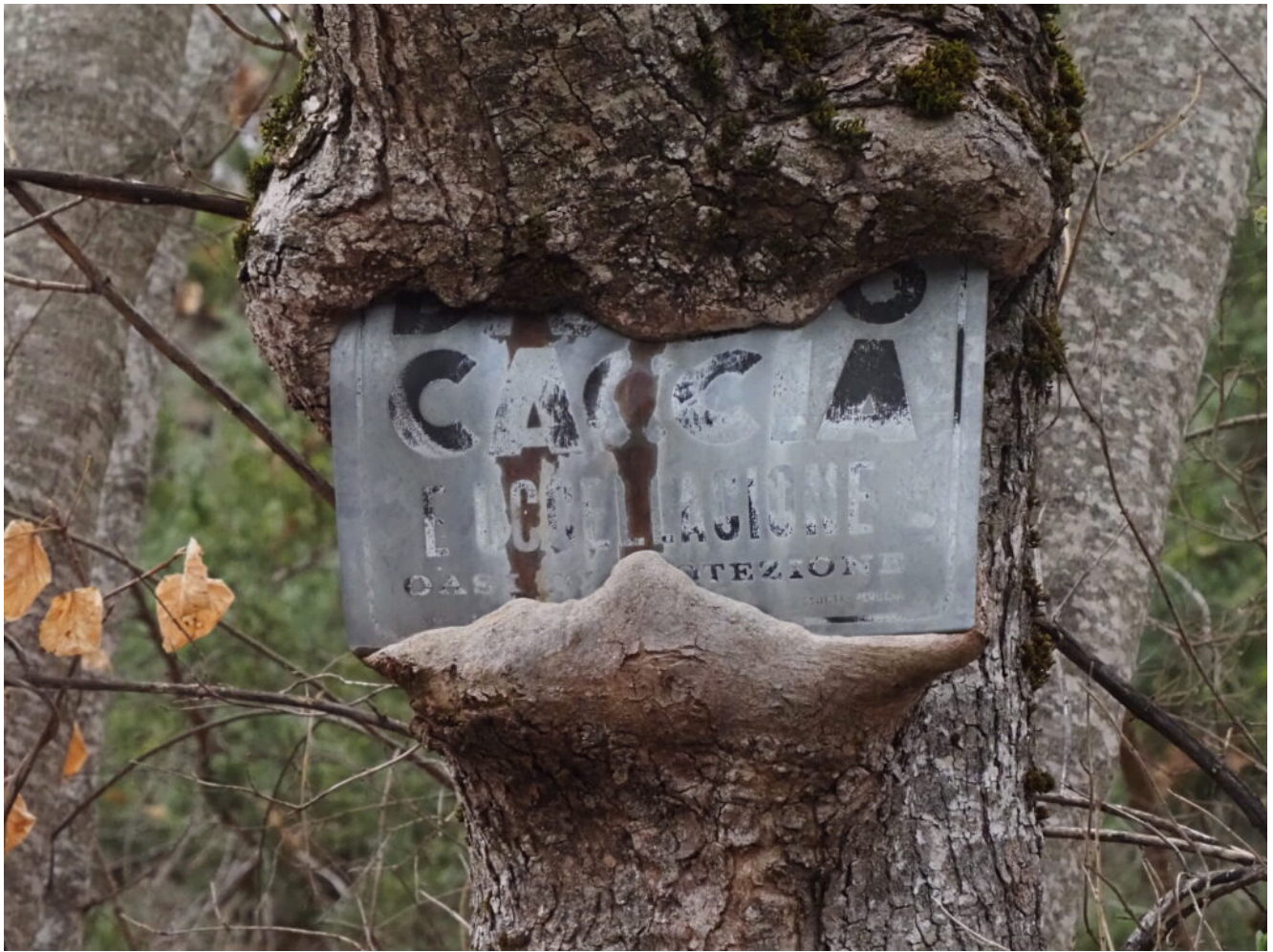
3- Una vecchia tabella di divieto di caccia inglobata dall'albero su cui era stata infissa.