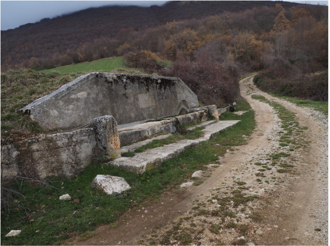
1- La fonte presente all'imbocco del tratturo