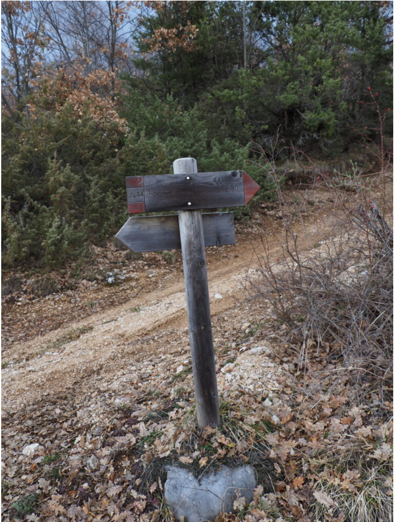
2- La deviazione per la Forca di Giuda stranamente segnalata.