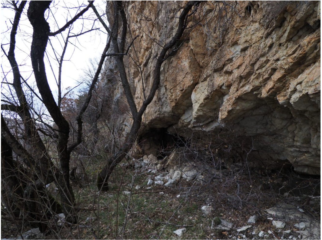
28 – 30 – La grotta più piccola presente alla base della fascia rocciosa superiore.