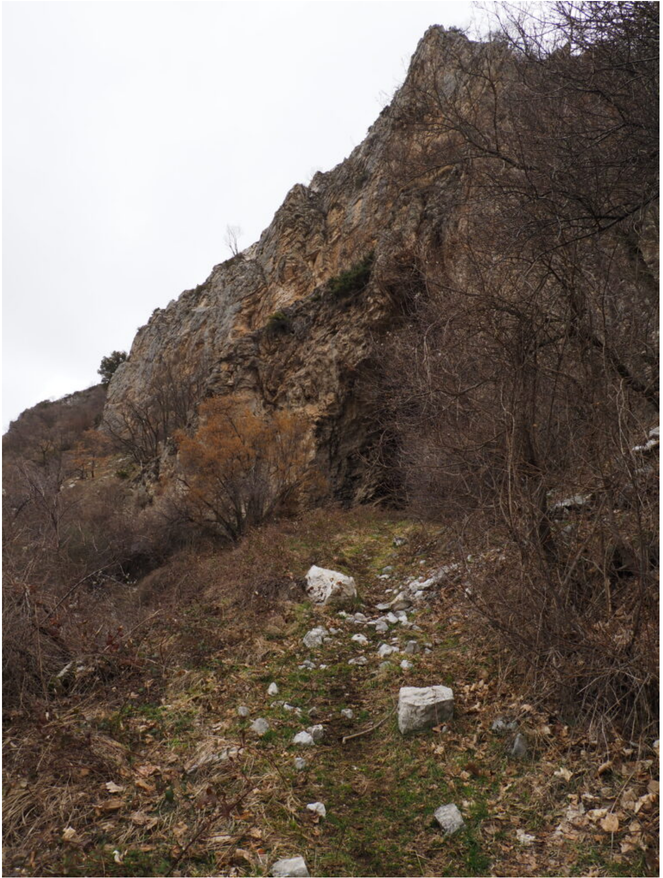
17- La parete che forma la Grotta.