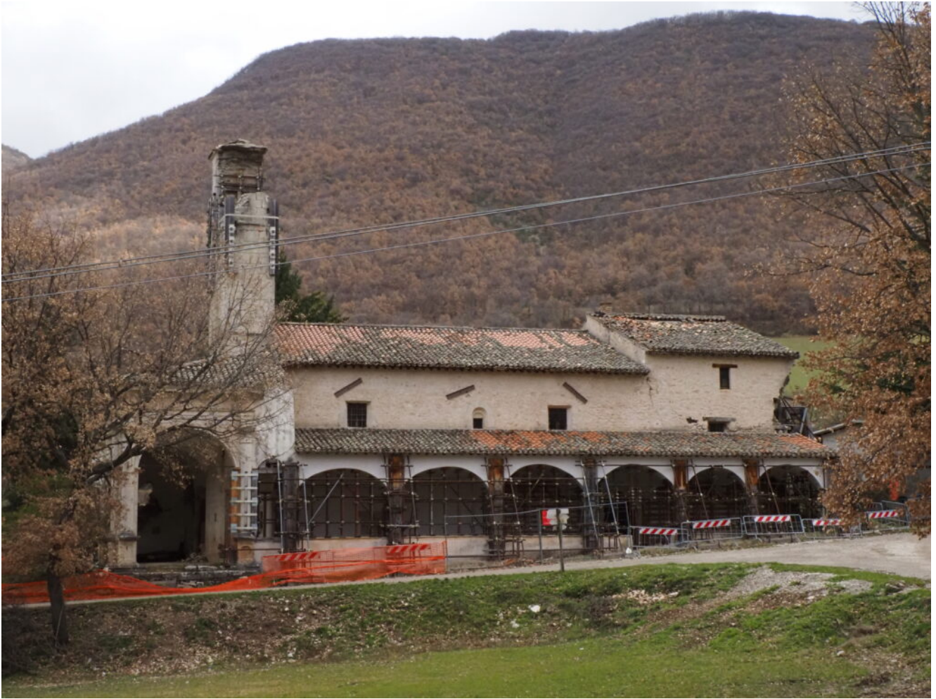
36-38- Ad Ancarano (Sant'Angelo) è presente la bellissima ma inagibile chiesa della Madonna Bianca.