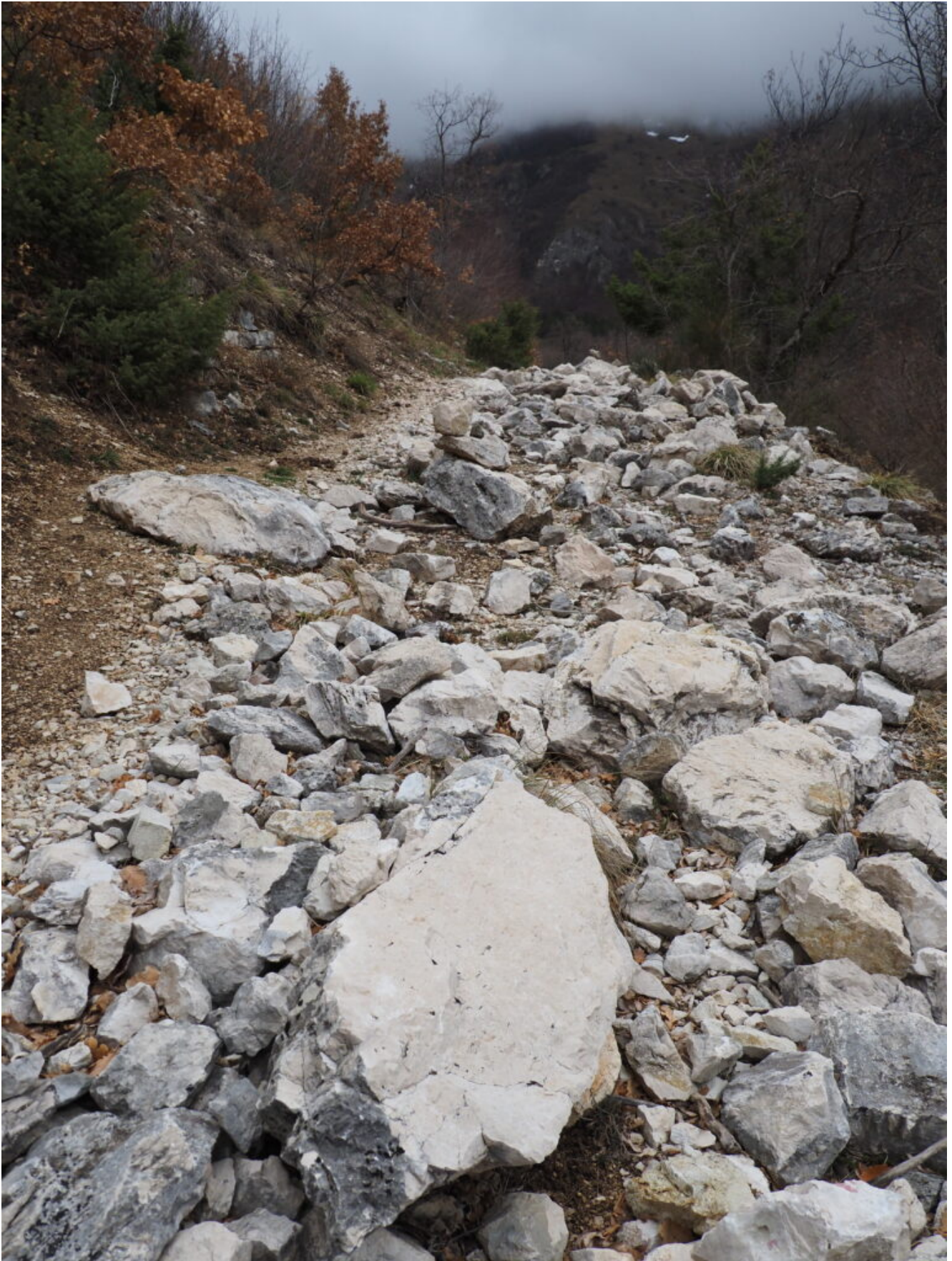
6- Il tratto pieno di massi caduti da terremoto alla base della parete della foto n.4.