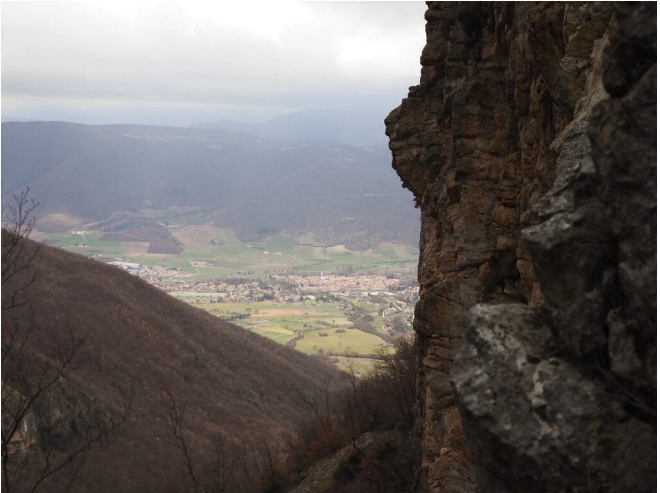
33- La città di Norcia