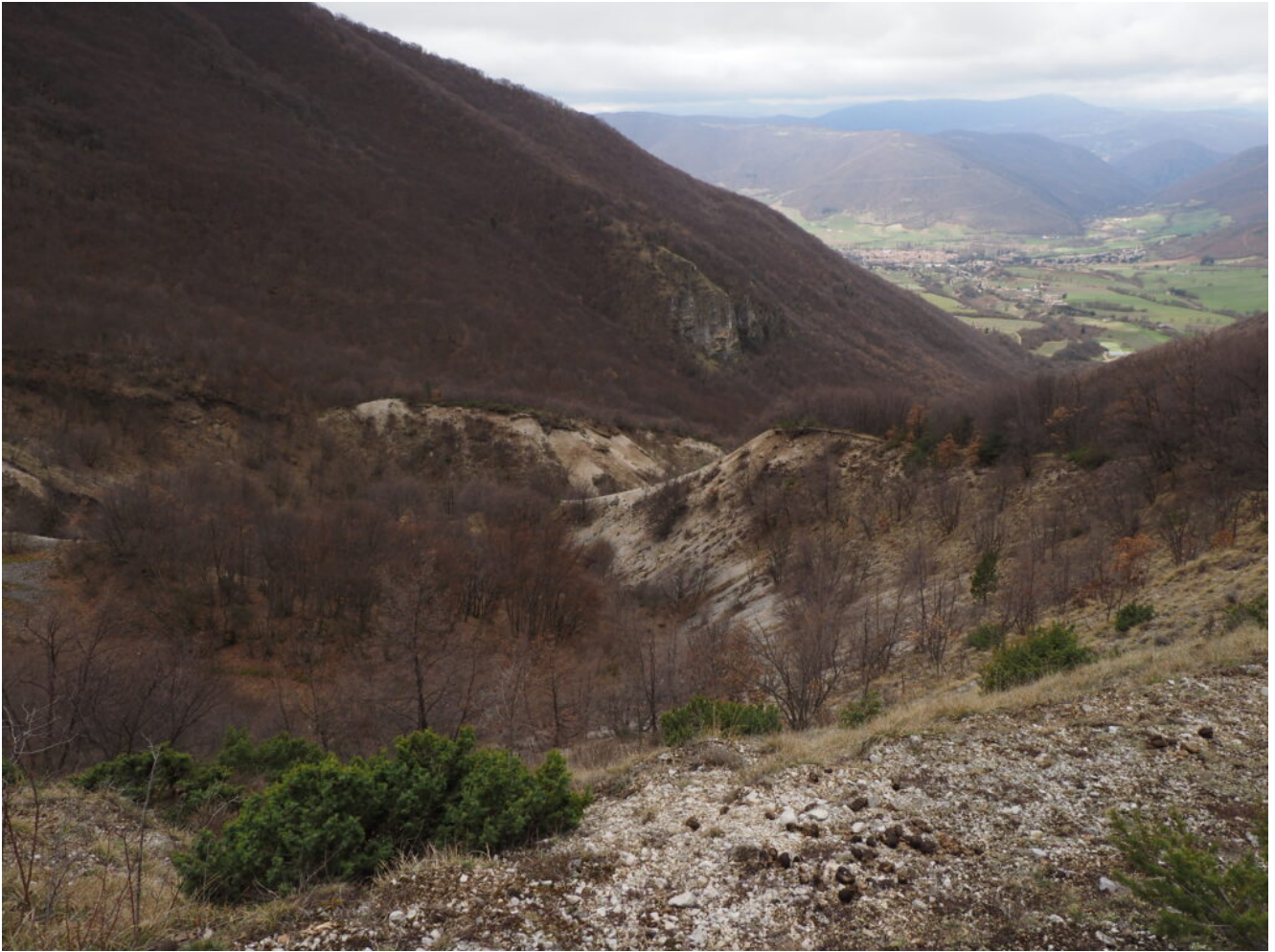
14- Il tratto all'uscita dal bosco dove si scopre Norcia.