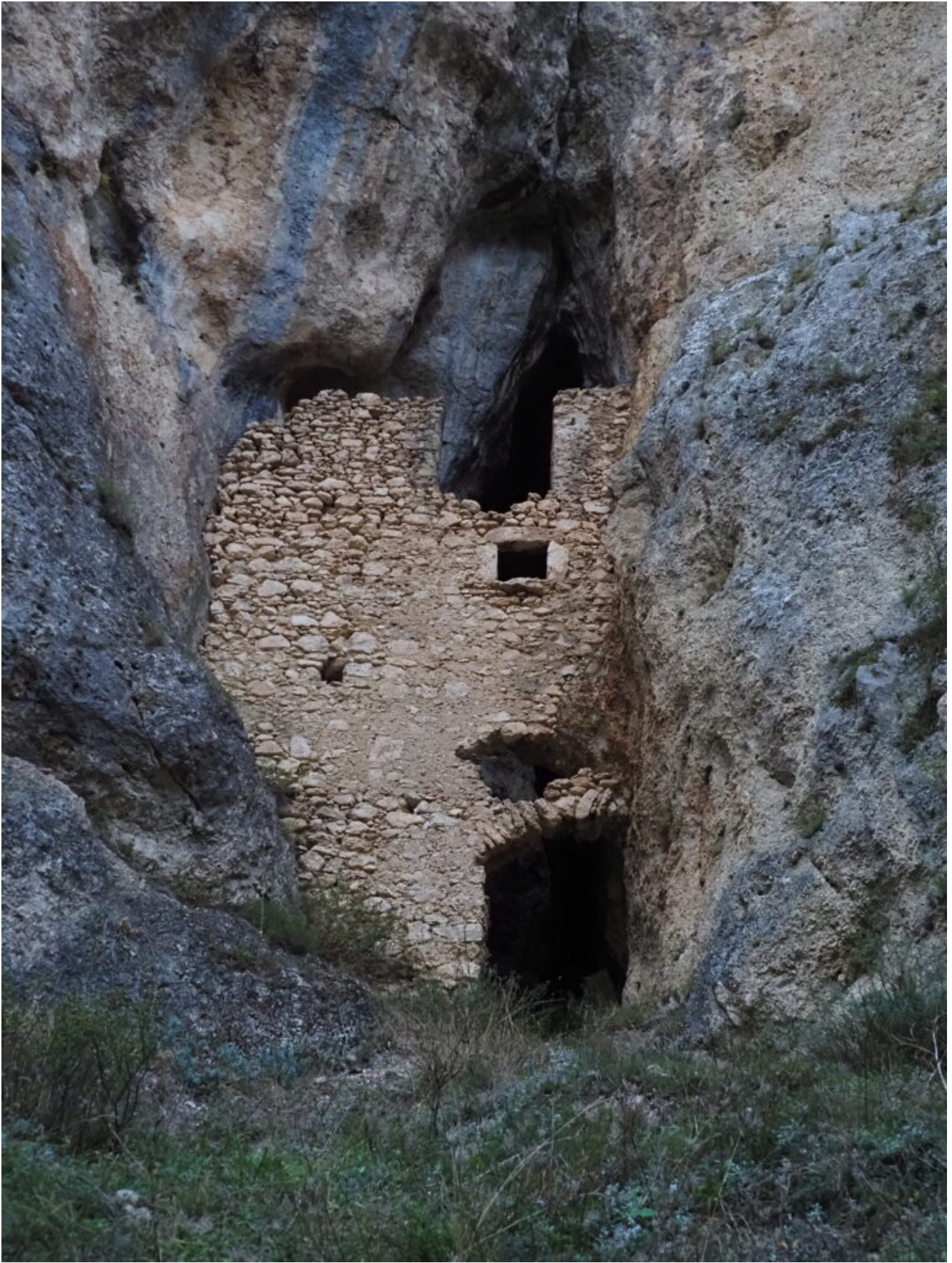
1 – 2- Un eremo senza nome costruito all'imbocco di una grotta nelle Gole del Sagittario.