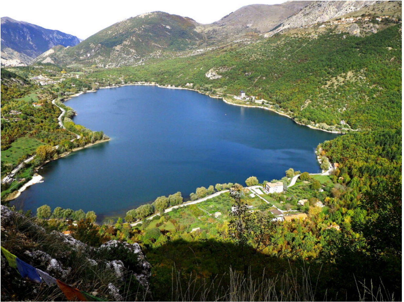
22- La ormai conosciutissima forma a cuore del Lago di Scanno vista dal Belvedere superiore.