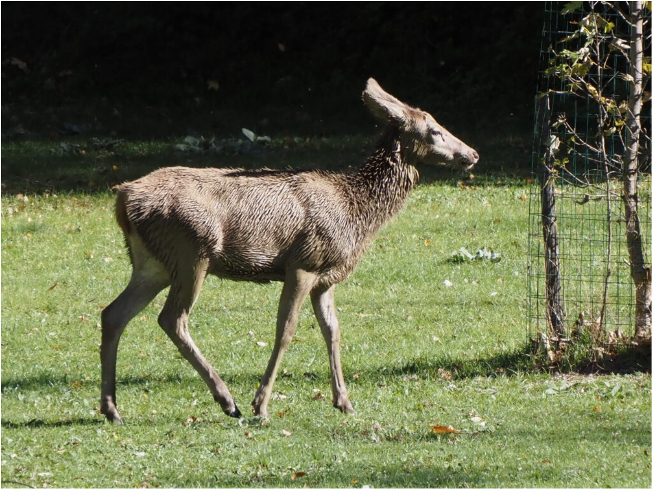
10 – Cervo giovane al pascolo nel parco pubblico.