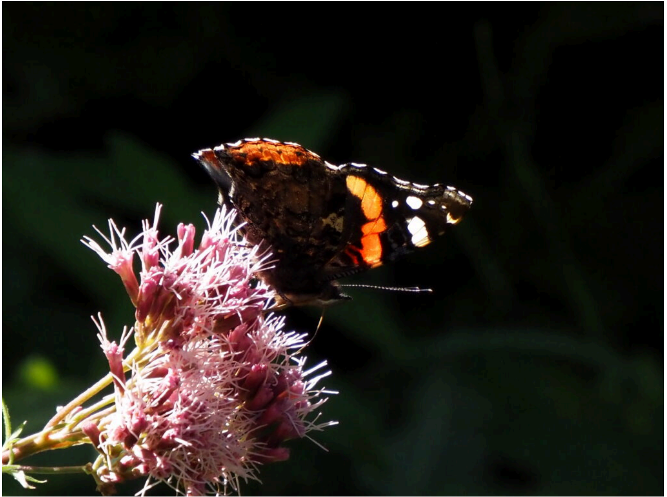
17- Va in giro perfino una Vanessa Atalanta.