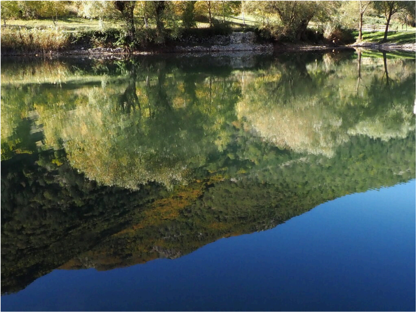
12 – 16 – Riflessi al Lago di Scanno.