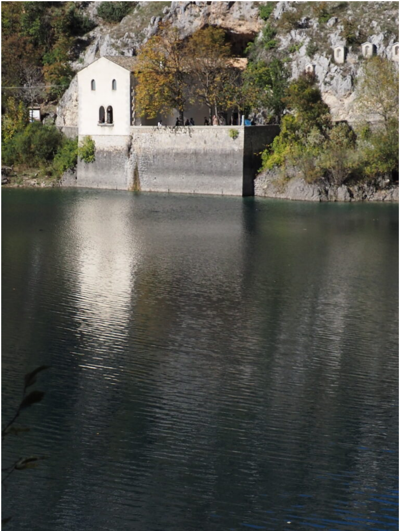
20- L'Eremitage di San Domenico sulla sponde dell'omonimo Lago.