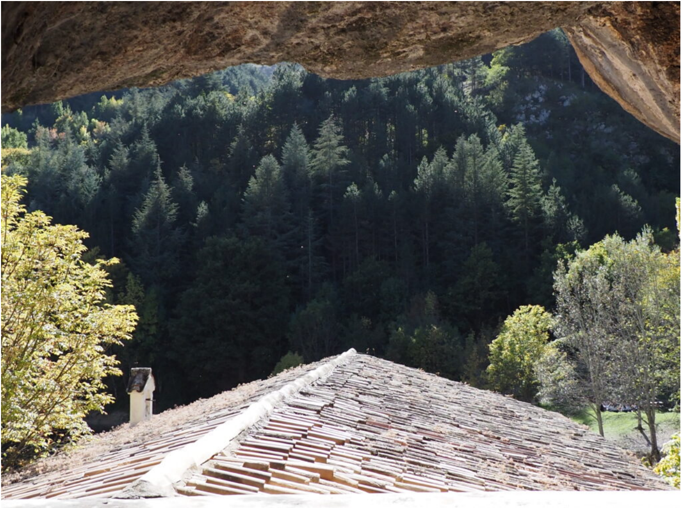
21- Veduta dalla Grotta posta dietro l'Eremo.