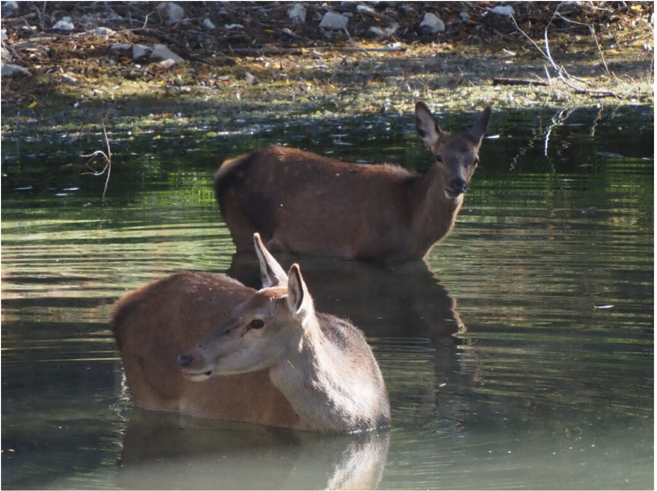
3 – 9 -Femmine di Cervo al bagno al mattino presto, date le alte temperature nonostante i primi di Novembre, nel Lago di San Domenico e nel Lago di Scanno.