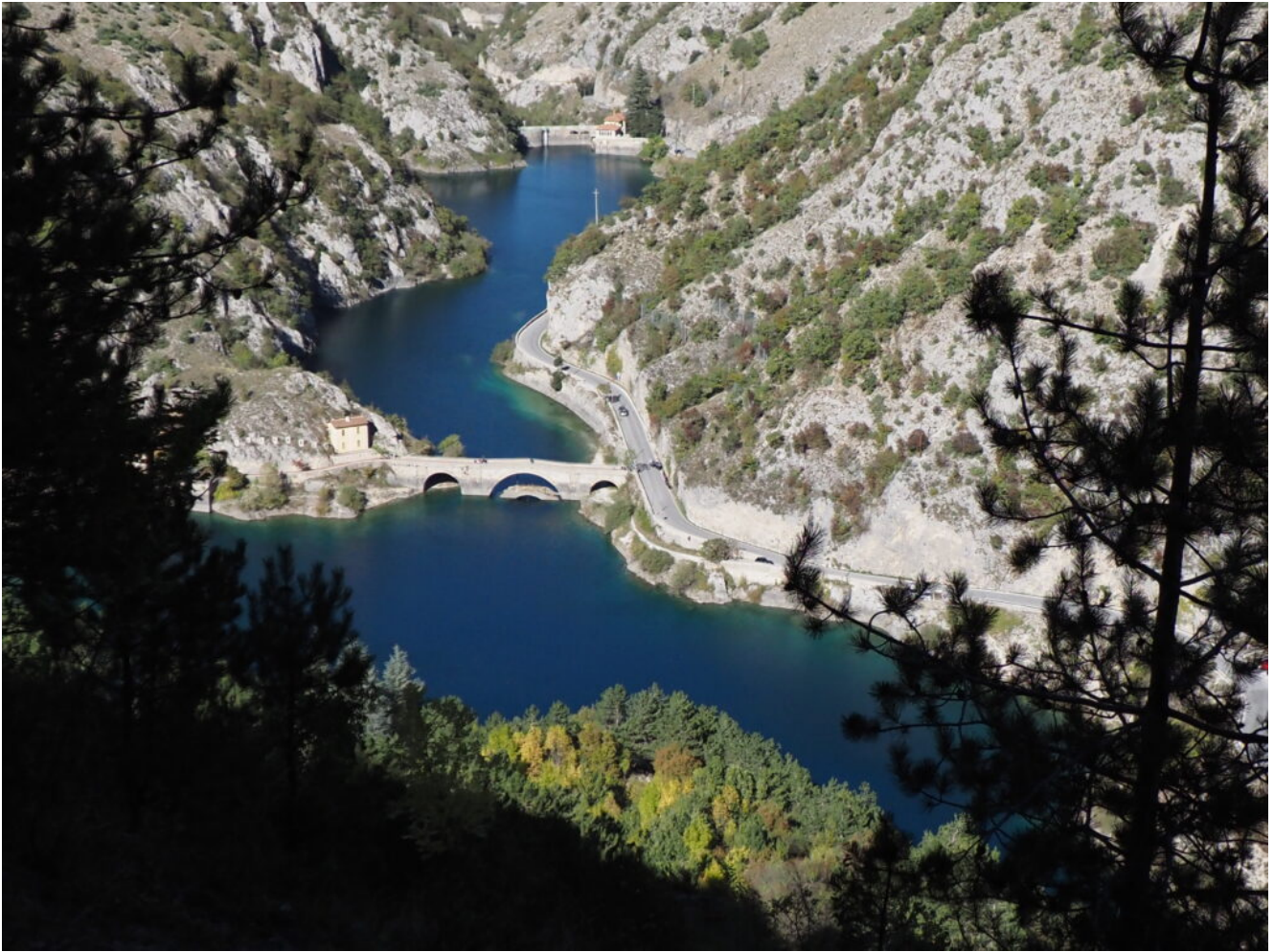
18 – 19 – L'azzurro Lago di San Domenico visto dal sentiero che da Villalago scende fino all'Eremo di San Domenico.