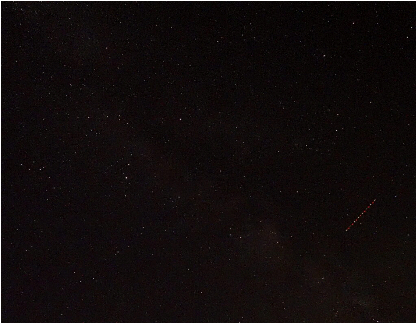
3- Altro passaggio di aereo nella zona della costellazione di Orione