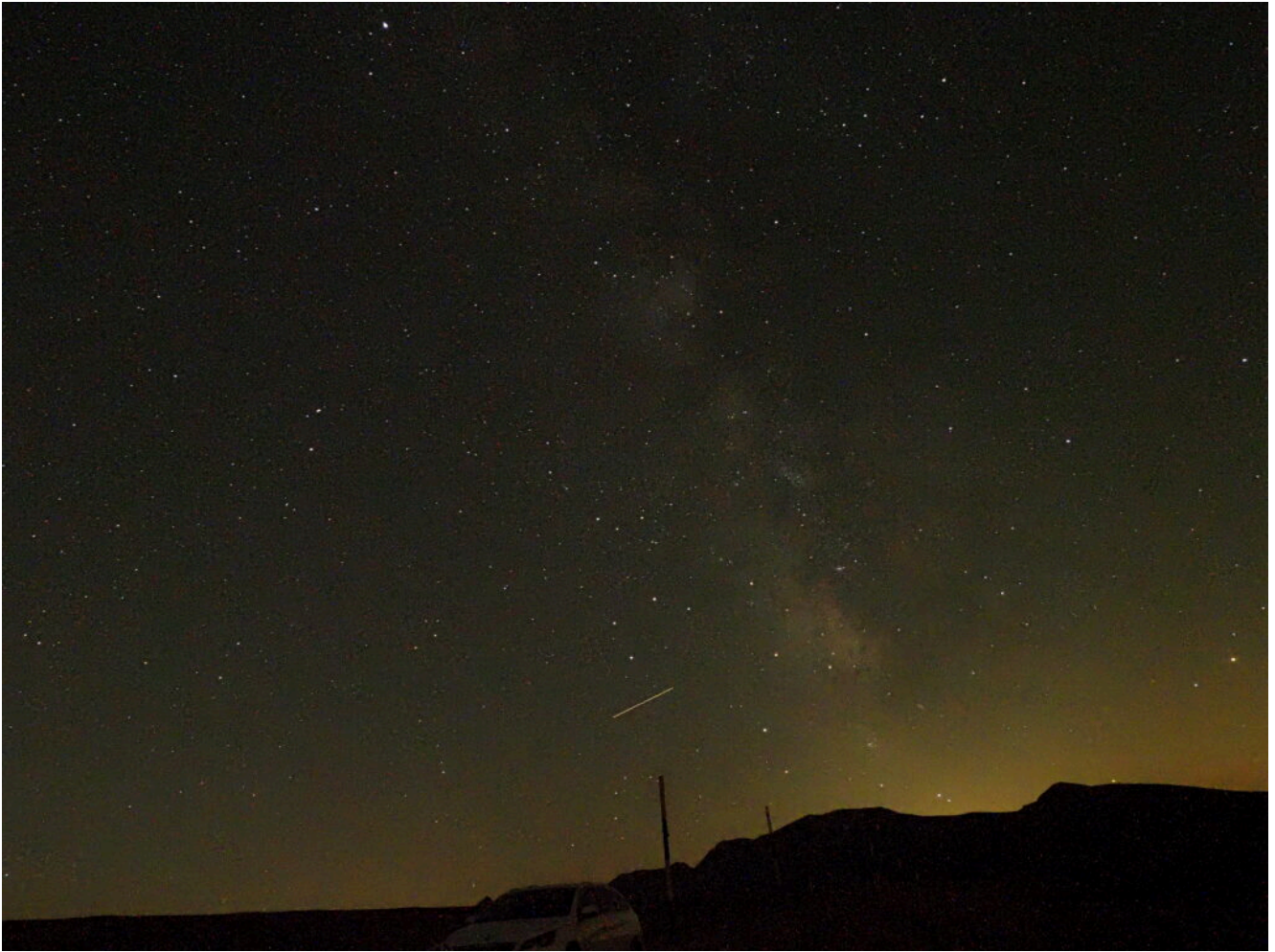
6 – 8 – La Via Lattea in diverse esposizioni.