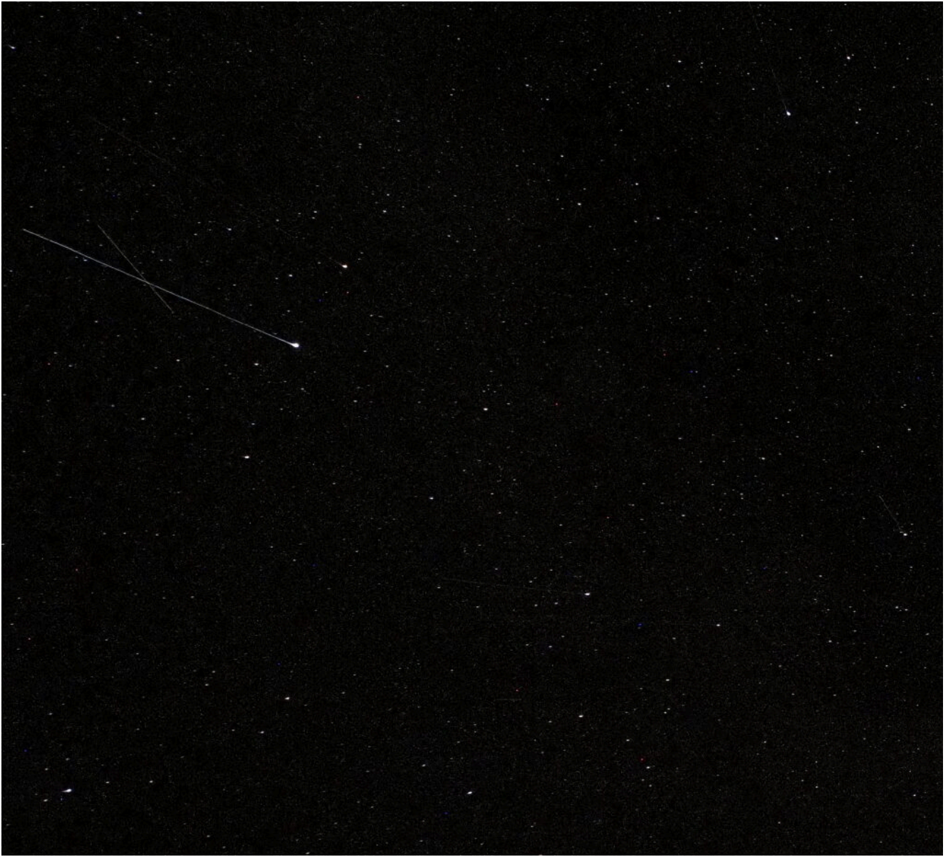
2- Passaggio di due meteoriti di diverse dimensioni.