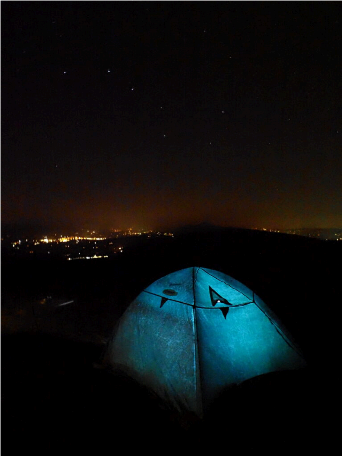
11- Il nostro punto di sosta notturna con Camerino sullo sfondo e l'Orsa Maggiore in alto nel cielo, un panorama meraviglioso.