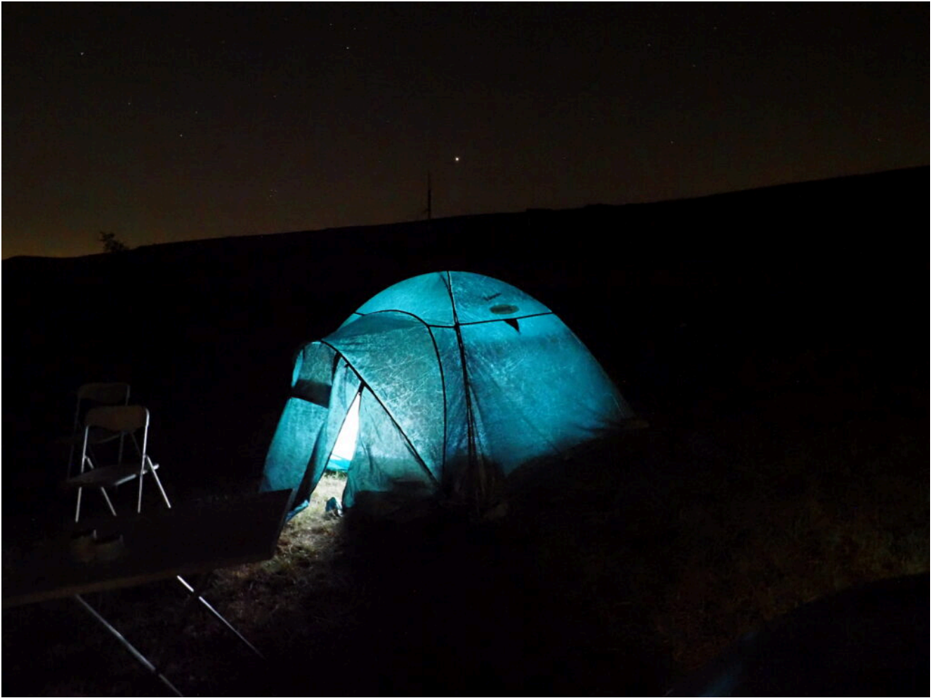
10- La tenda per la notte.