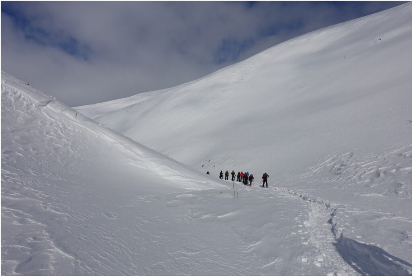
10 – 13- La valletta che conduce verso Capanna Ghezzi.