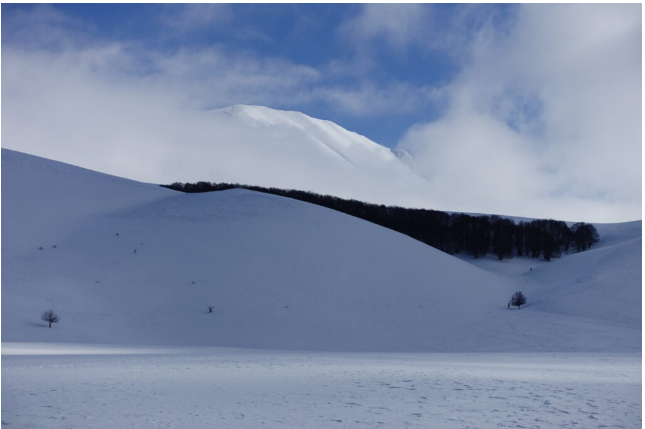
26- Ripassiamo di fronte al boschetto del Pian Perduto chiudendo il percorso della giornata.