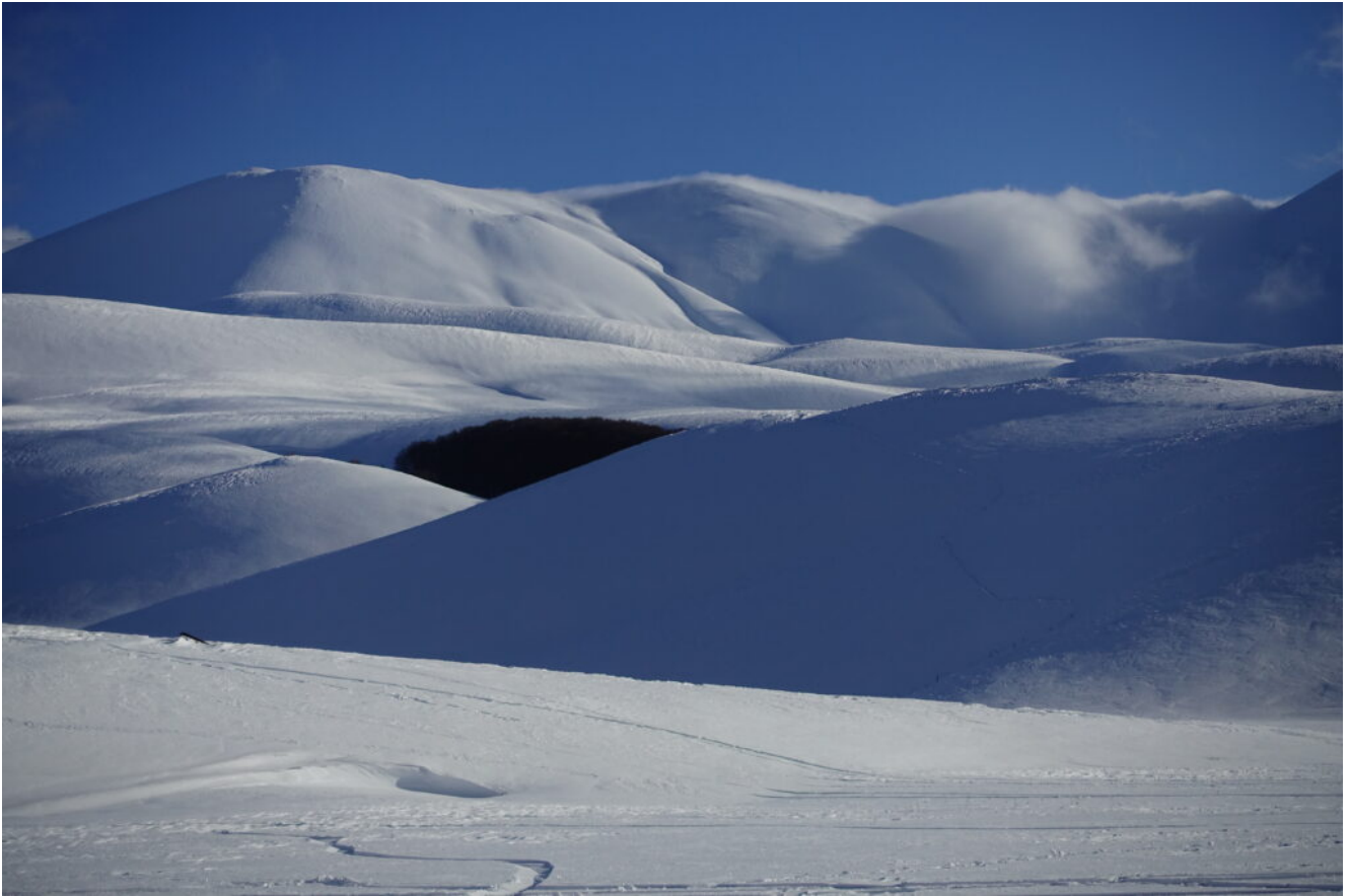
2- Il boschetto dei Colli Alti e Bassi che abbiamo raggiunto per la valletta Ovest.