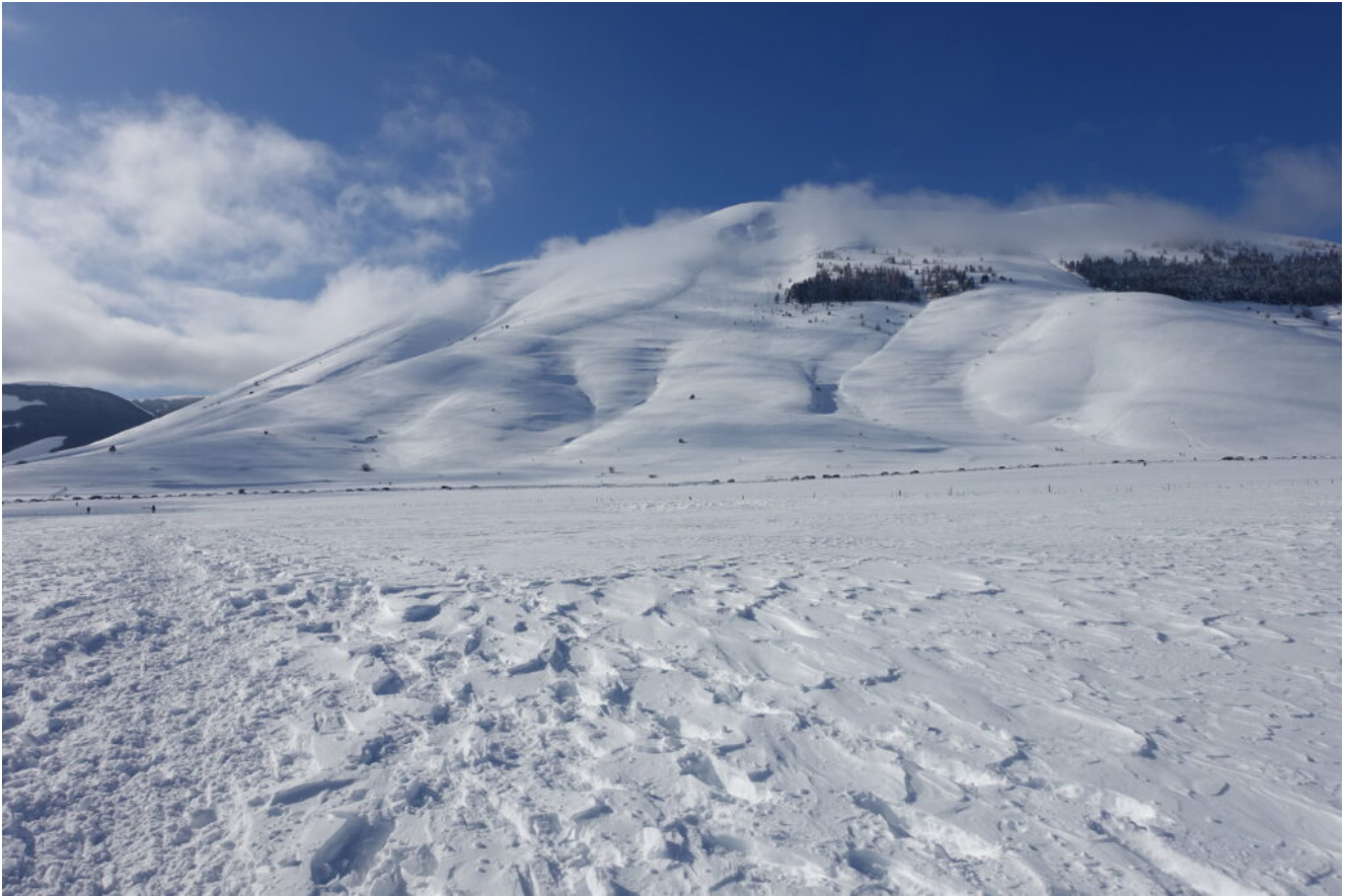
27- Il Monte Lieto, situato di fronte al Pian Perduto, sulla strada una lunga fila di auto di escursionisti..