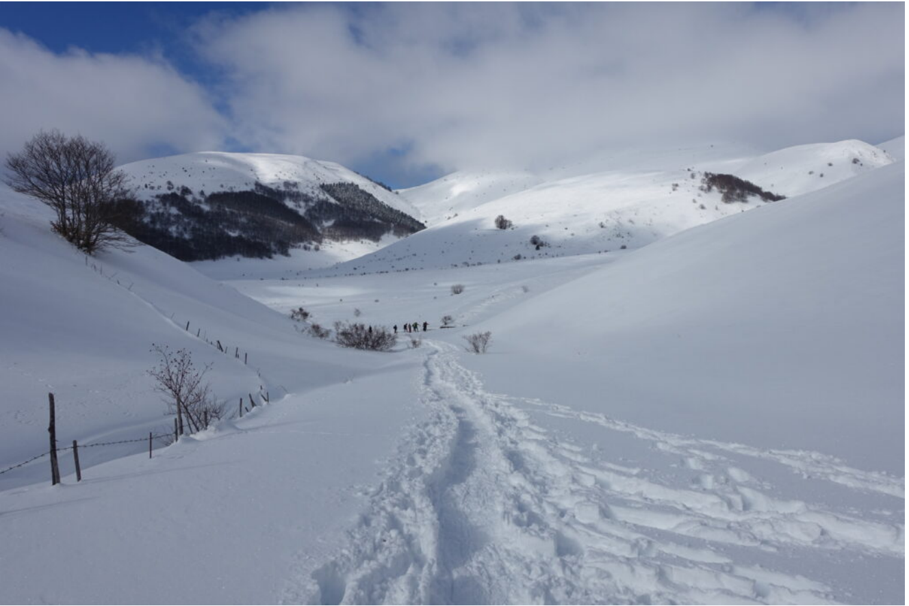
18- La conca del San Lorenzo.