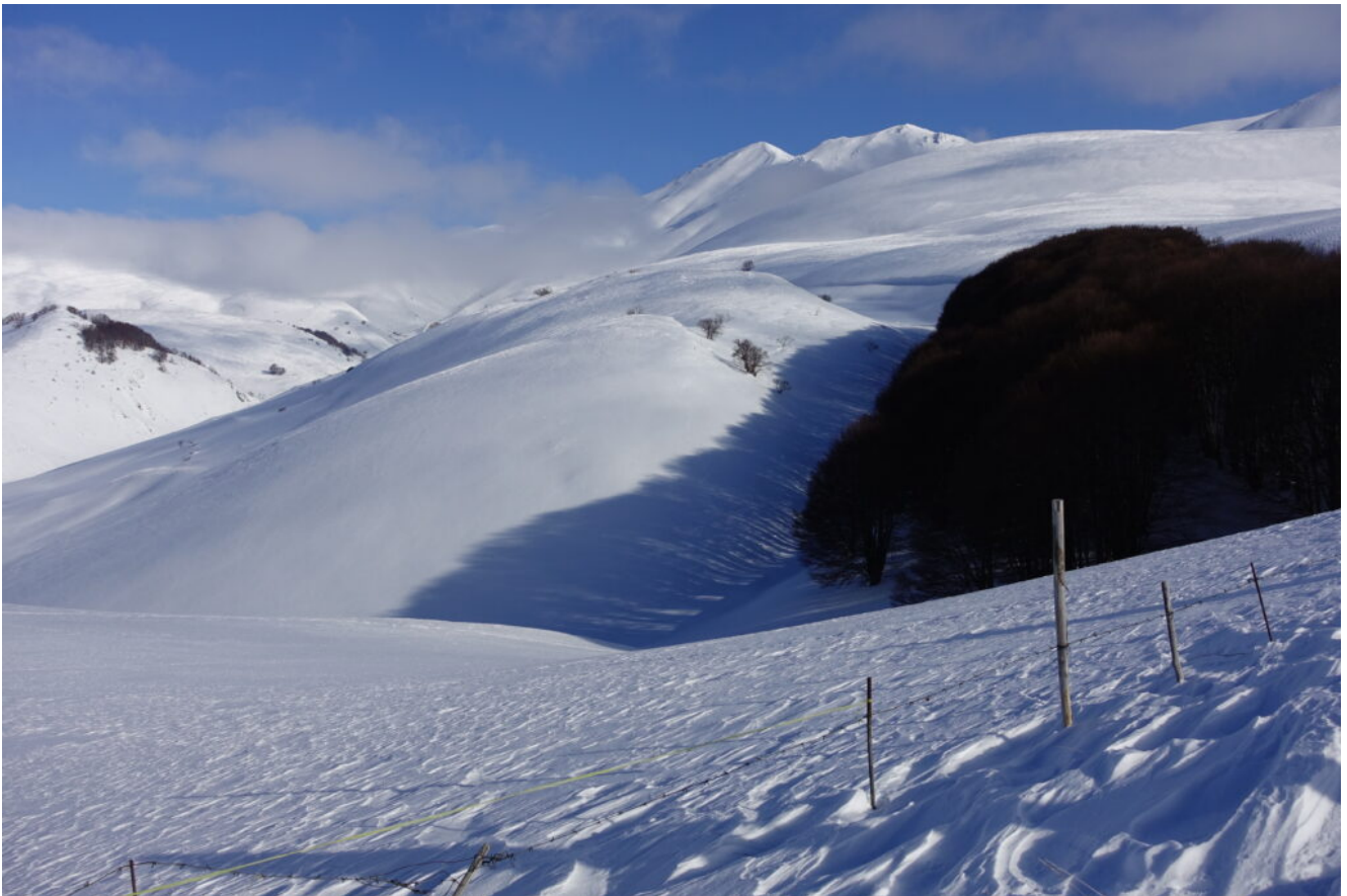
3- Il Boschetto dei Colli Alti e Bassi con il Monte Porche sullo fondo.