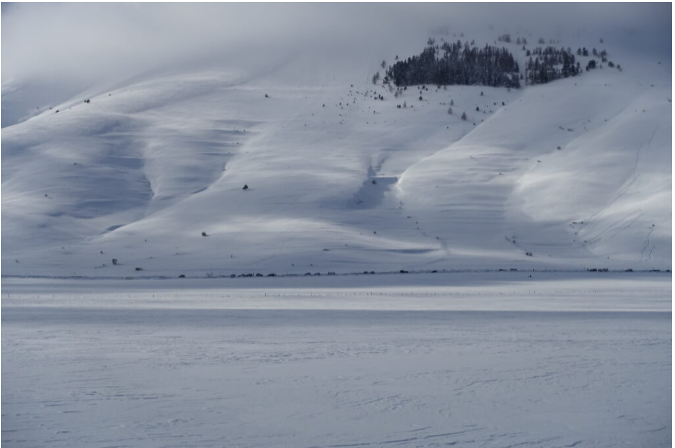
28- Siamo ormai giunti anche noi all'auto concludendo la splendida ciaspolata.