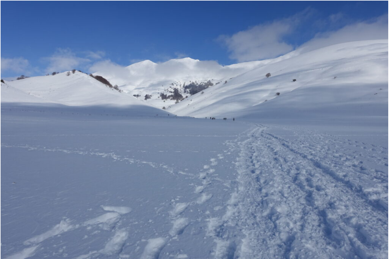
25- Attraversando il Pian Perduto