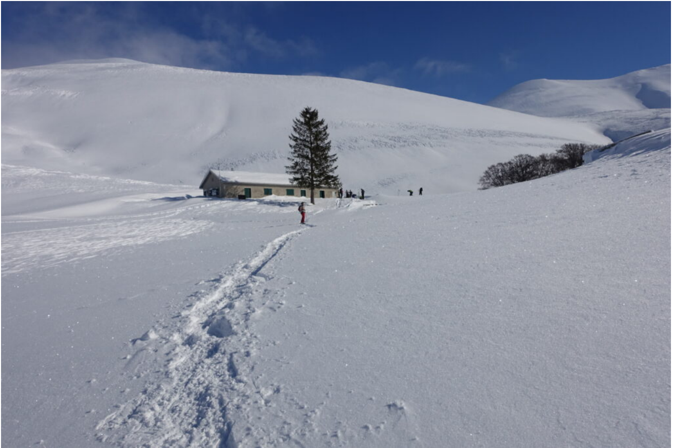
16- La Capanna Ghezzi, alle falde del versante Ovest del Monte Argentella.