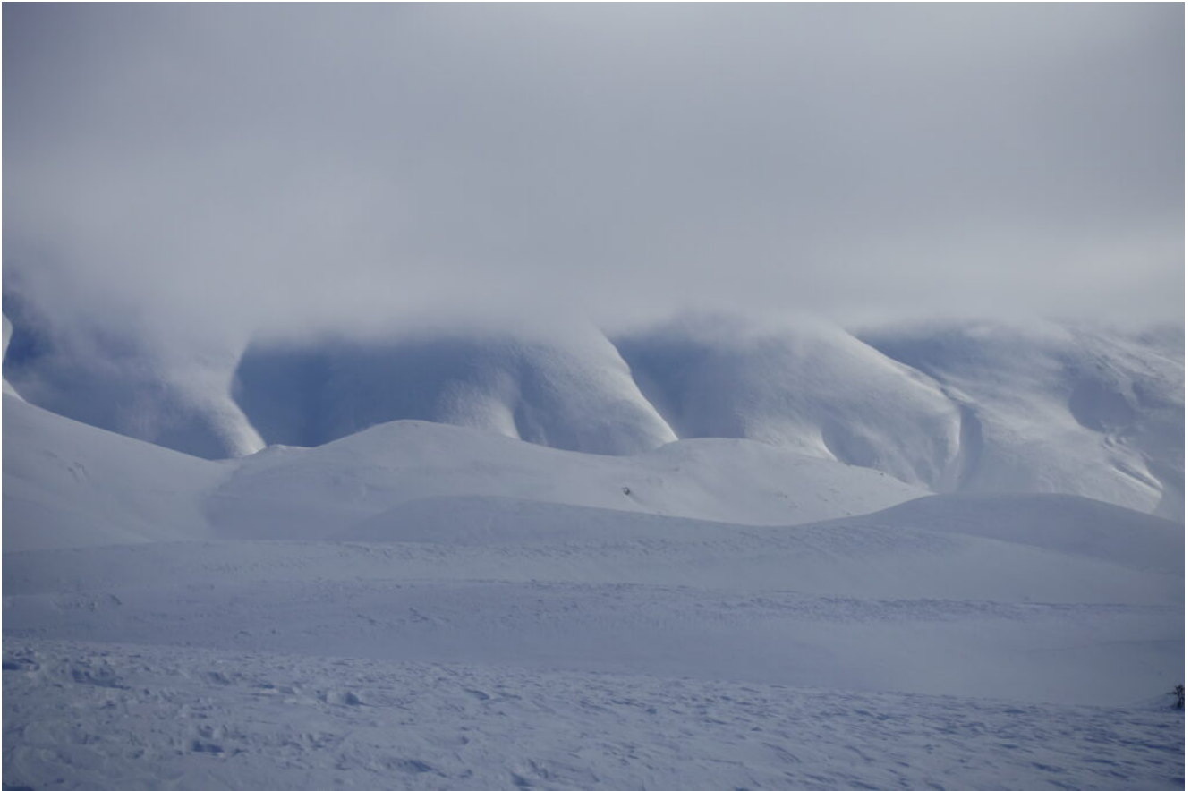
4 – 5-Le pendici Ovest della Cima del Redentore tra la nebbia.