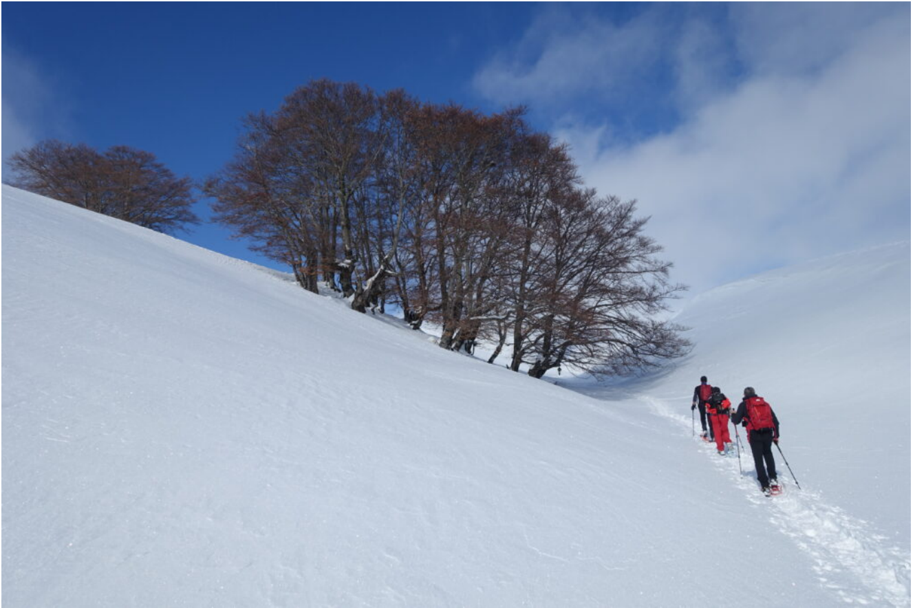
14 – 15- I nuclei di Faggio nei pressi della Capanna Ghezzi.