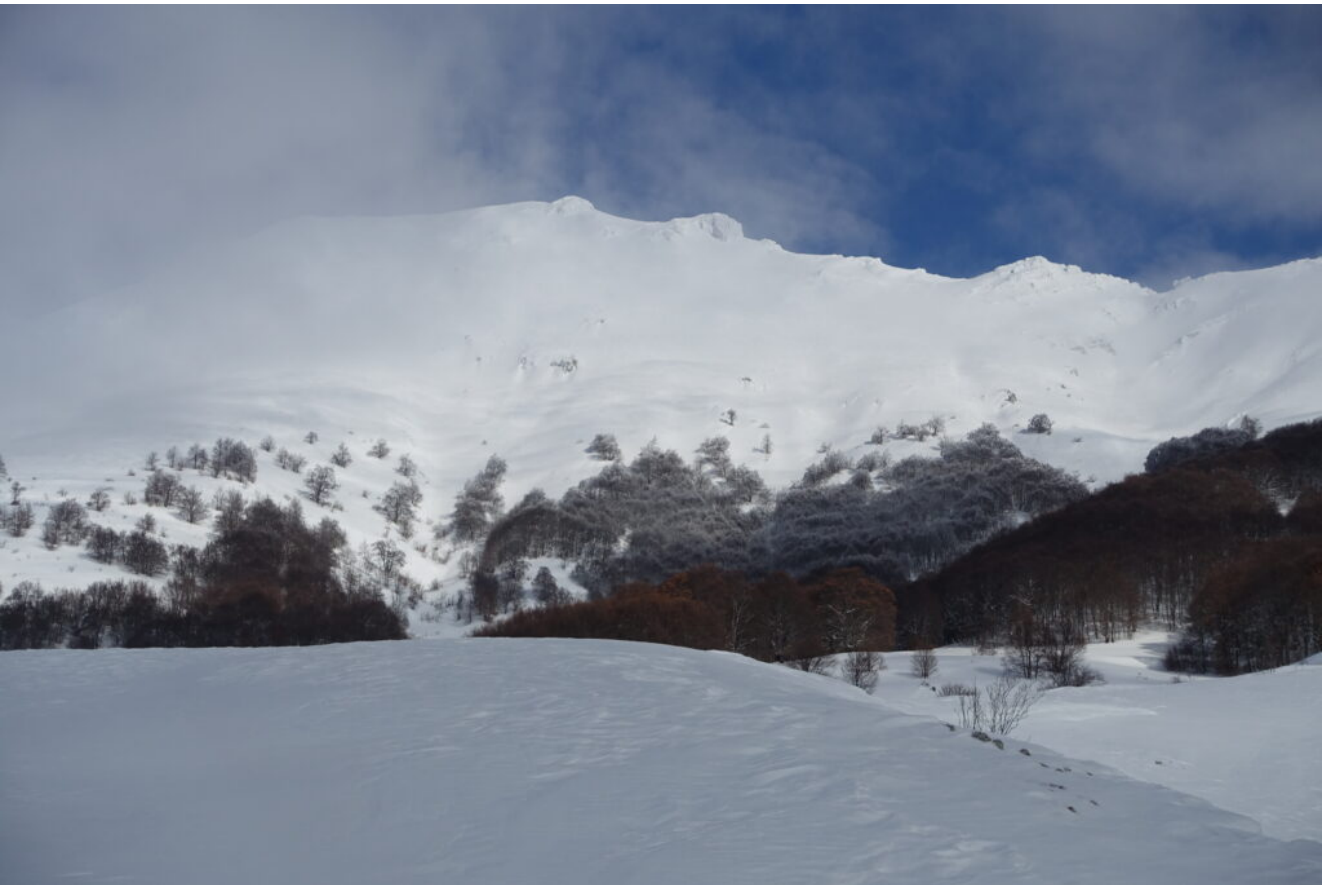
19- Il Monte Palazzo Borghese visto da San Lorenzo.