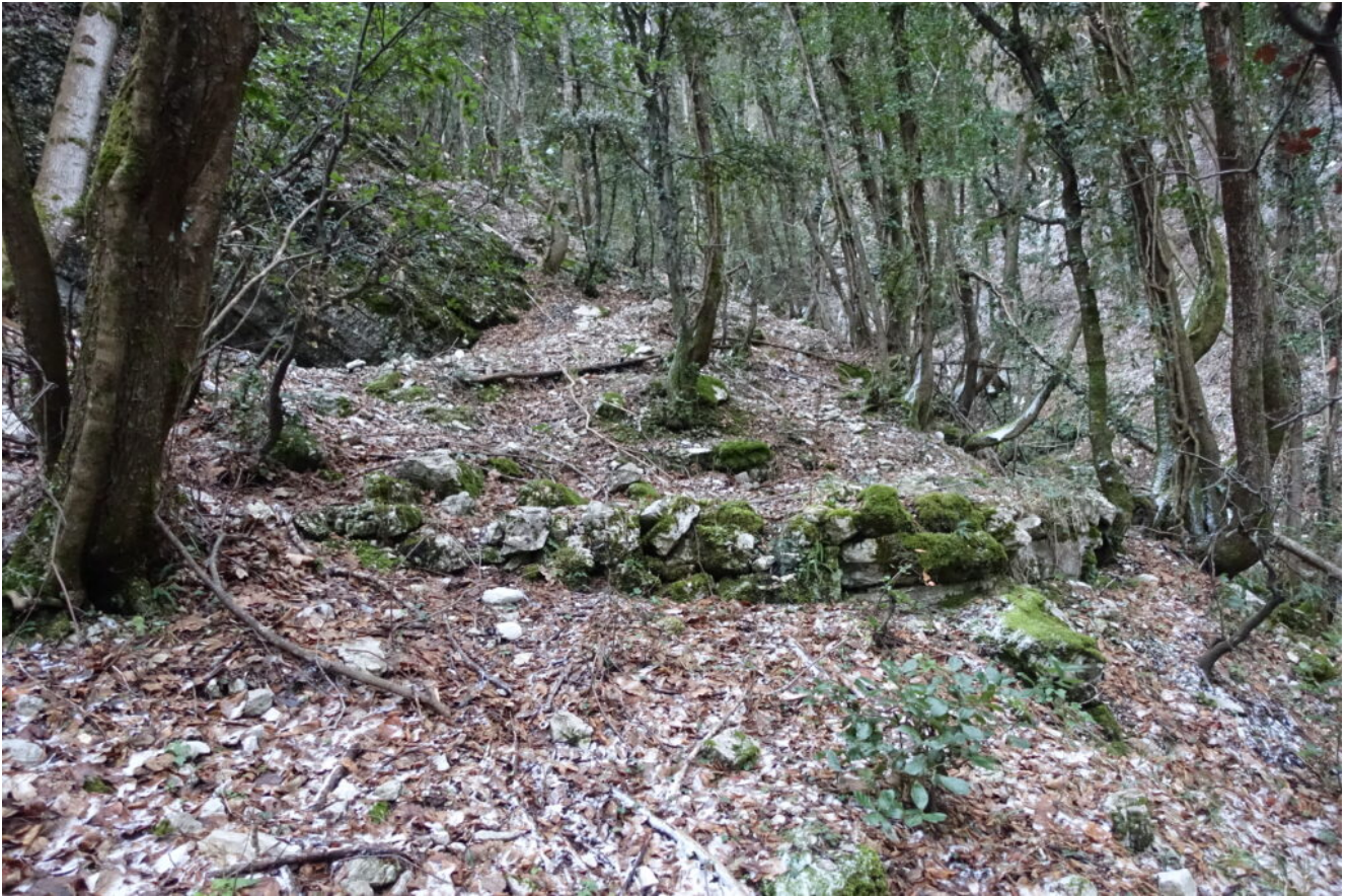
4- La piattaforma di una vecchia carbonaia poco prima della cascata.