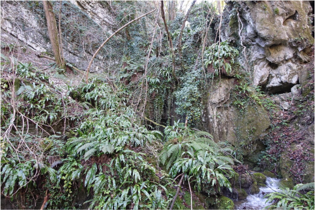
19 – la parte sinistra della “Fessa” da cui si può risalire per osservare la seconda cascata nascosta.