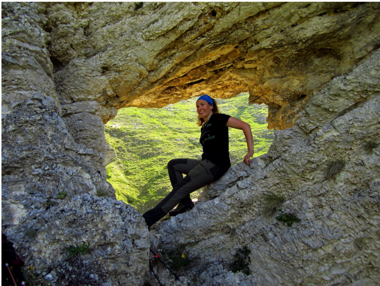
6- La finestra che si affaccia sul ramo sinistro molto più articolato e portante acqua.