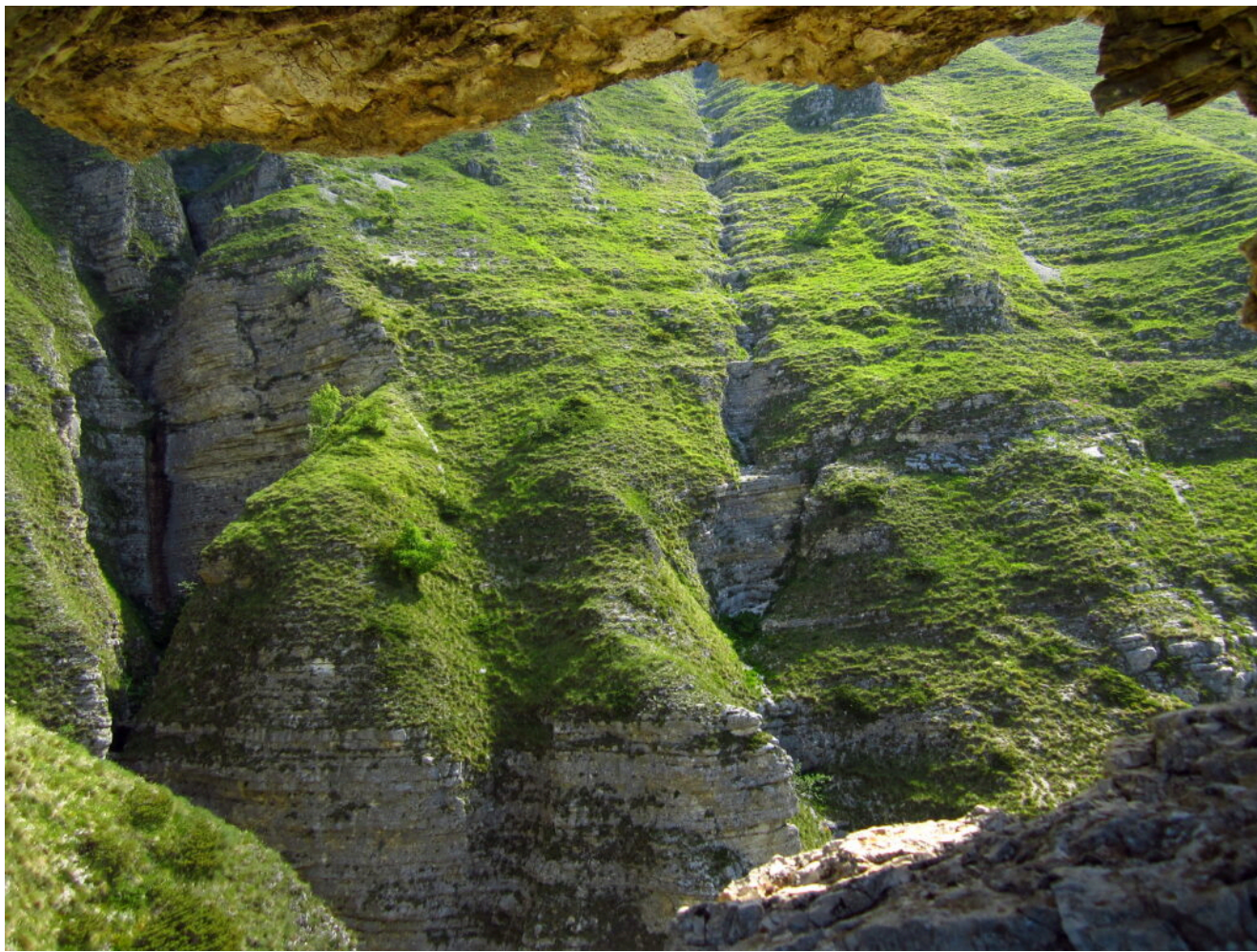
7 – 8 – Il ramo sinistro visto dalla finestra.