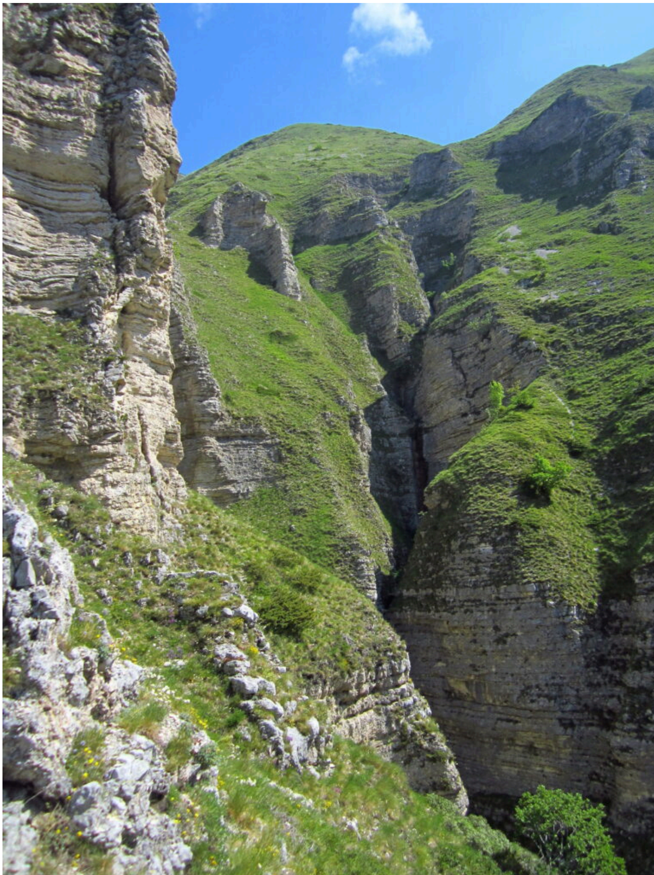
10- Il ramo sinistro con le due cascate che confluiscono proprio dove passa il tracciato, la seconda si scopre solo quando si è sotto.