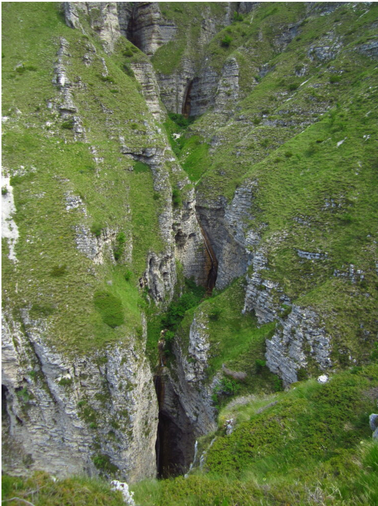
22- La parte inferiore del Fosso La Foce vista dallo sperone sinistro, in basso la grande cascata alta più di 70 metri.