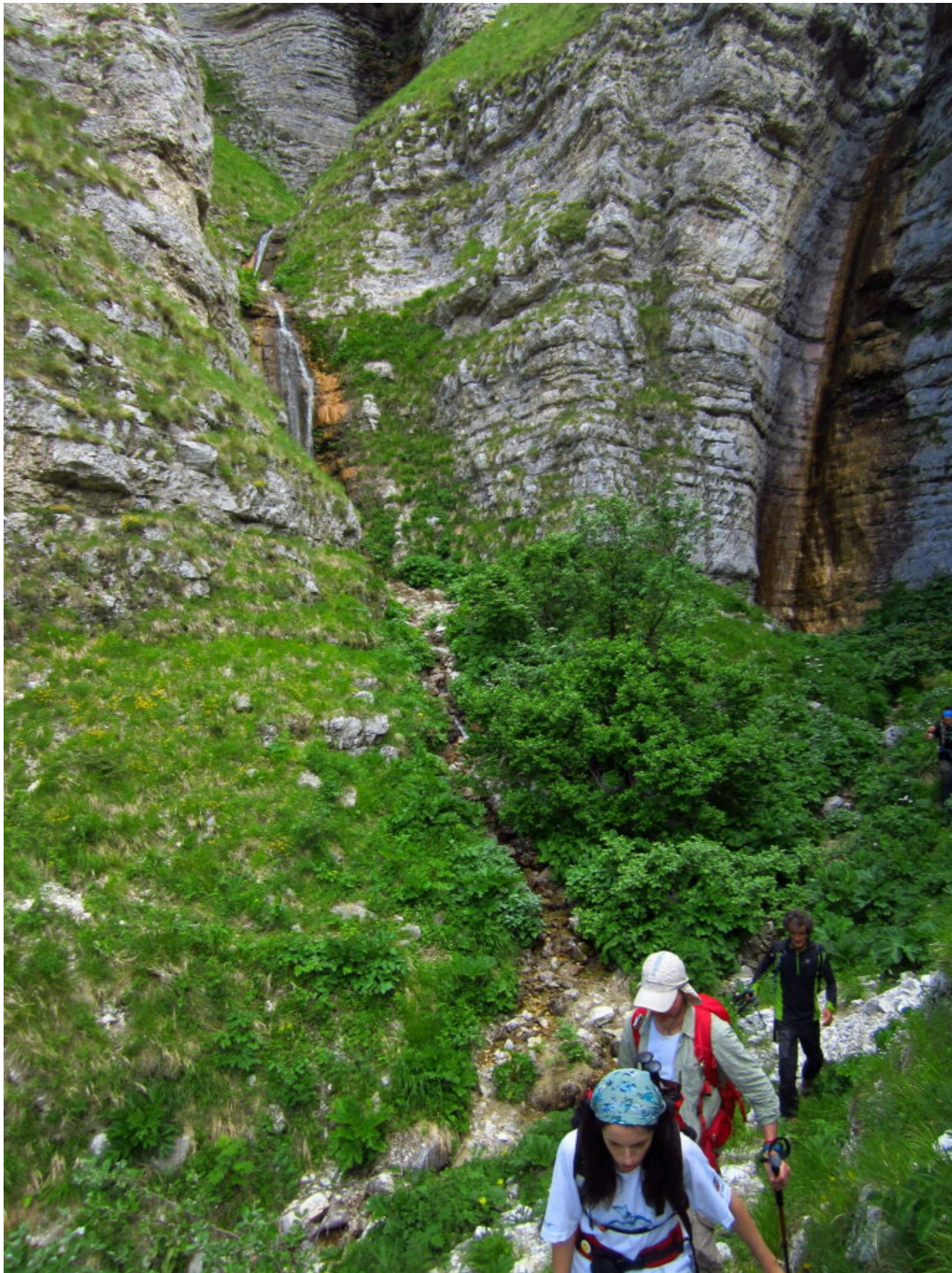
19 – 20- Tutte e due le cascate del ramo sinistro.