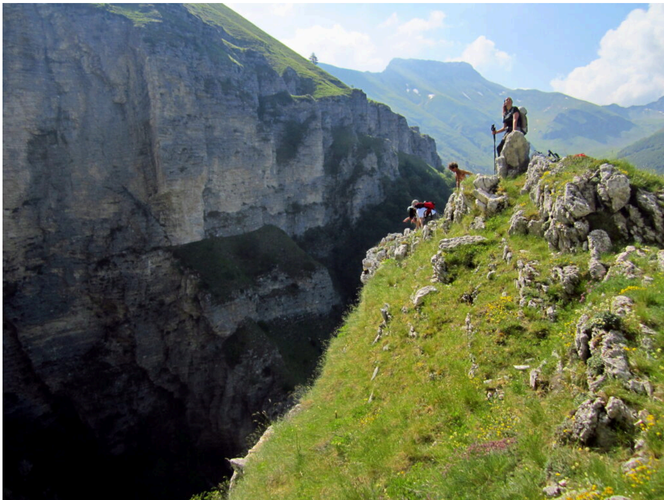
3- Il primo sperone del ramo destro orografico