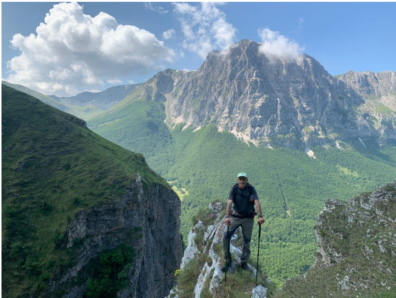
11- Lo sperone centrale che divide il ramo sinistro in due ulteriori rami formanti cascate distinte