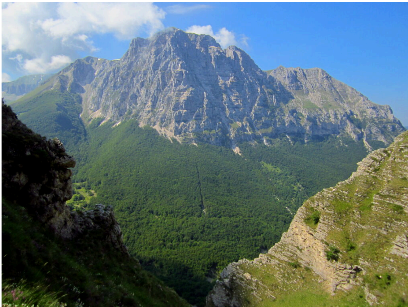
5- Di fronte la dolomitica parete Nord del Monte Bove Nord con l'intaglio nel bosco prodotto dalle frane causate dal terremoto del 2016.