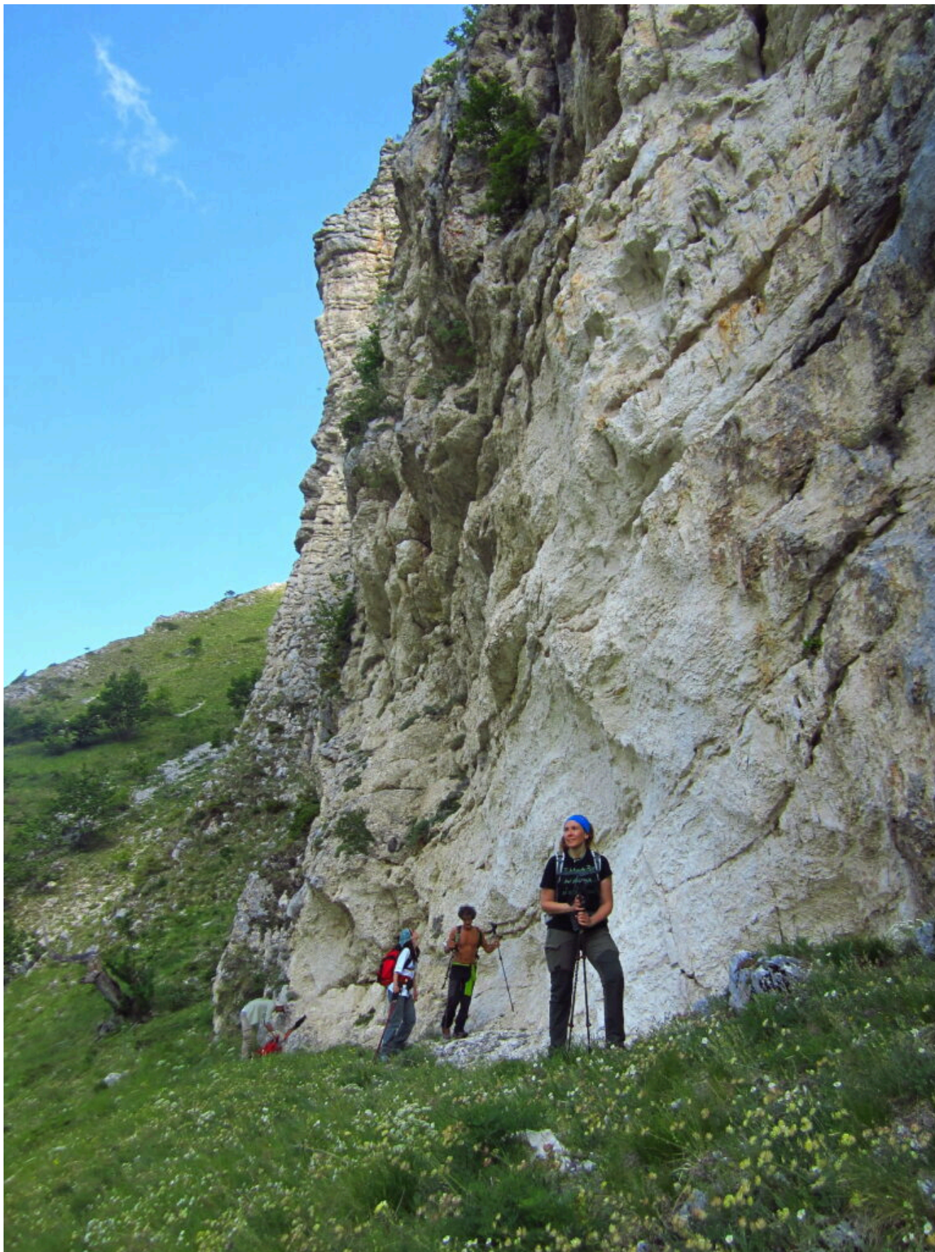
1 – 2 I primi torrioni del fosso dopo i prati di Casali.