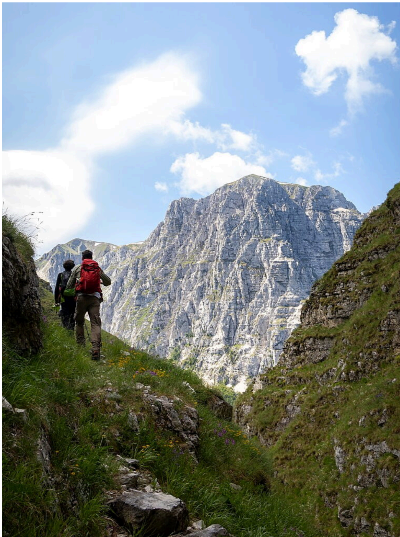
12- 13 – L'interno del ramo sinistro .