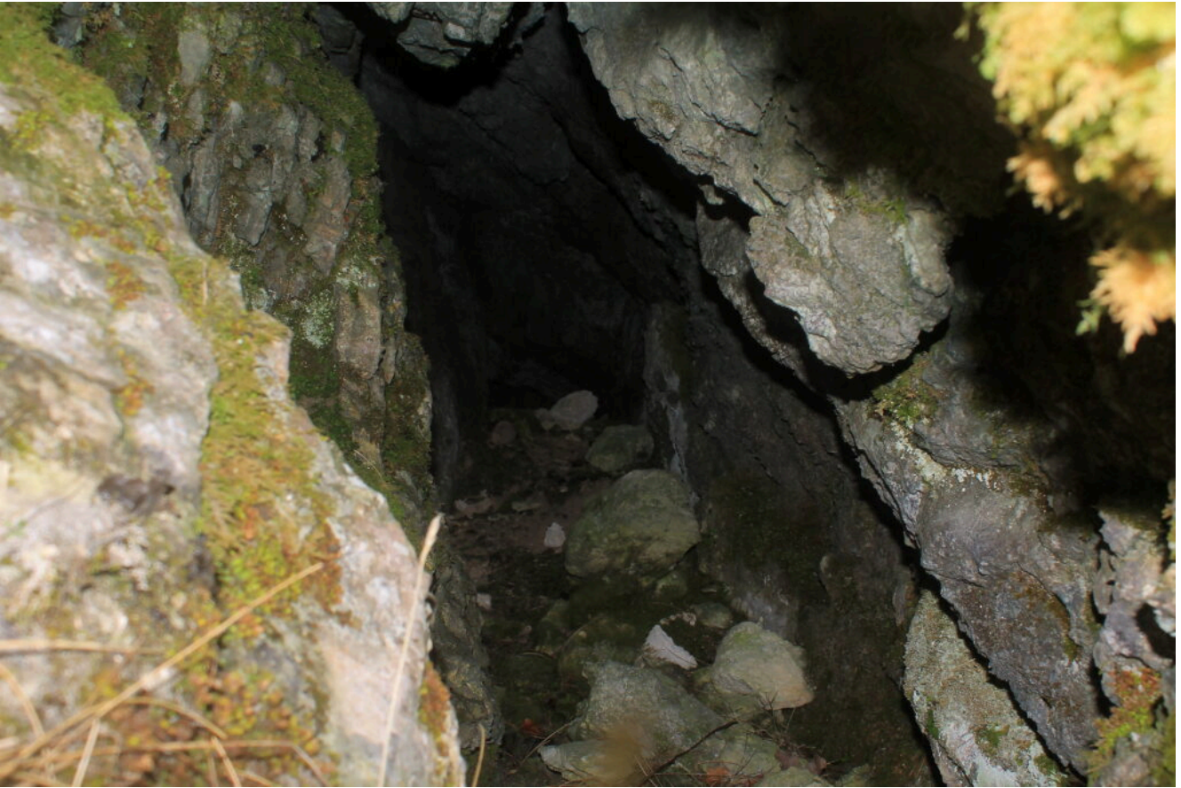
12- La grotta inferiore, molto profonda.