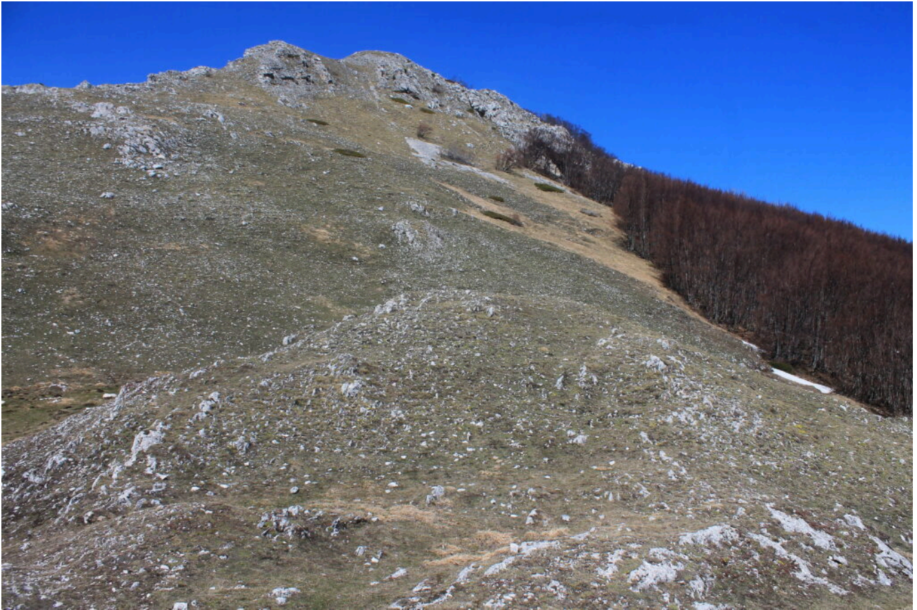
1- Il pendio Sud del Monte Sassotetto con la faggeta che bisogna costeggiare per raggiungere la grotta grande, visto dalla Forcella.