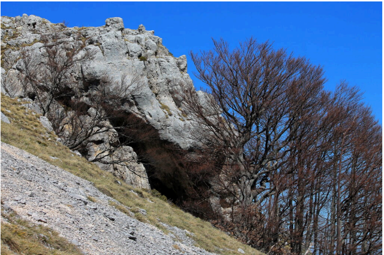
2 - 3-Il torrione roccioso che forma la grotta grande, al